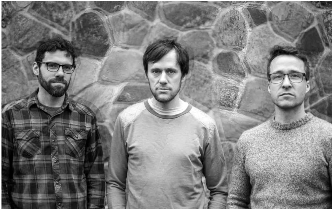
Psychédélicues, même sur la photo : Pick a Piper.