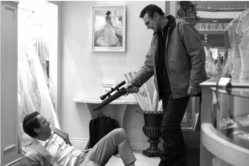
Liam Neeson ist schon wieder (oder immer noch) auf einem Rache trip, diesmal im Schnee: „Cold Pursuit“ neu im Kinepolis Belval und Kirchberg.