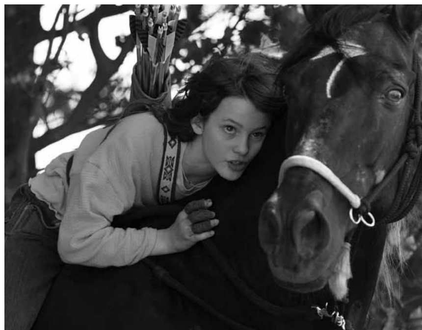
Das Leben ist doch ein Ponyhof... manchmal: „Ostwind 4: Aris Ankunft“ ist neu im Kinepolis Belval und Kirchberg.

Durch ihre Ehe mit Franz II. wird Maria Stuart 1559 zur Königin von Frankreich. Als ihr Mann nur zwei Jahre später stirbt, weigert sie sich, erneut zu heiraten. Stattdessen beschließt sie, in ihre Heimat Schottland zurückzukehren und den Thron zu besteigen, der rechtmäßig ihr gehört. Doch die schottische Krone trägt mittlerweile Elisabeth I; die zugleich auch Königin von England ist. Es kommt zu einem Machtkampf zwischen den beiden Monarchinnen.