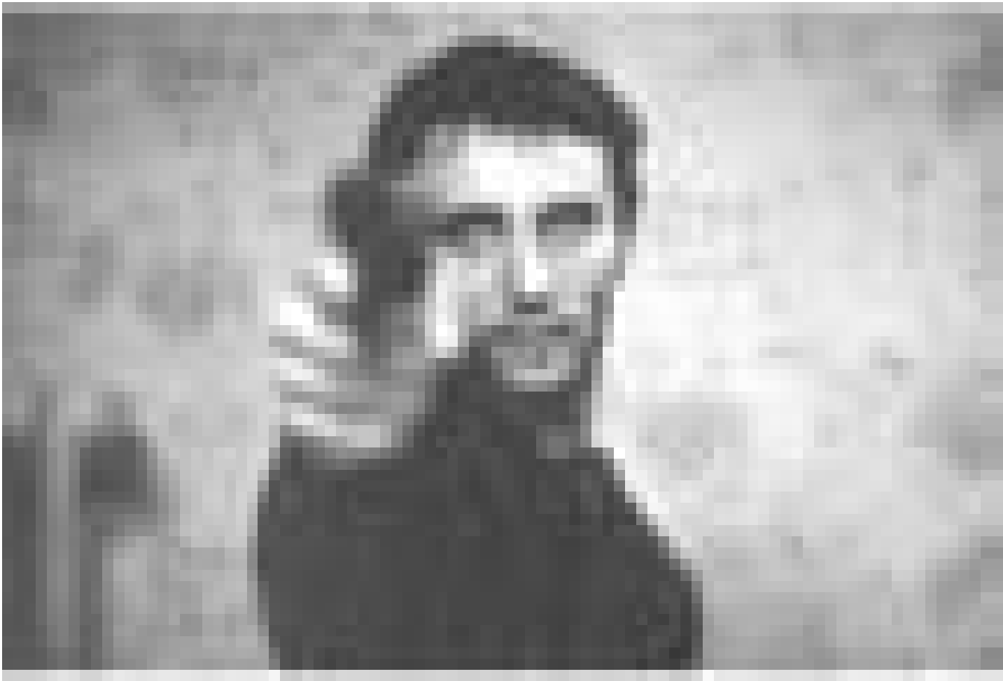
Peut-on mourir pour ces beaux yeux? "Roberto Succo" de Cédric Kahn. Nouveau à l'Utopia.

Romantische Komödie: Sara Dee-ver hat sich eine recht außeerge-wöhnliche Lebensaufgabe ausge-dacht: Jeden Monat beginnt sie ei-ne neue Liebesaffaire. Der Auser-wählte für den Monat November ist Nelson Moss, ein unvergleichlicher Egomane. Saras Talent die guten Seiten aus jedem herauszuholen, wird ihr jetzt zum Verhängnis: für