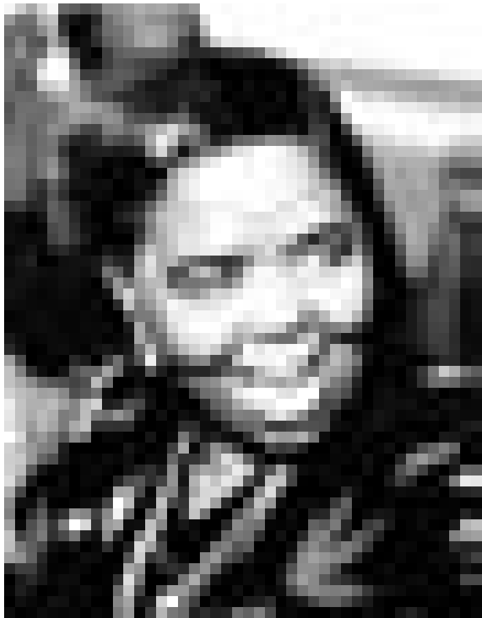
Cesaria Evora in Music Planet, ARTE, samedi 18.11., 0h10.