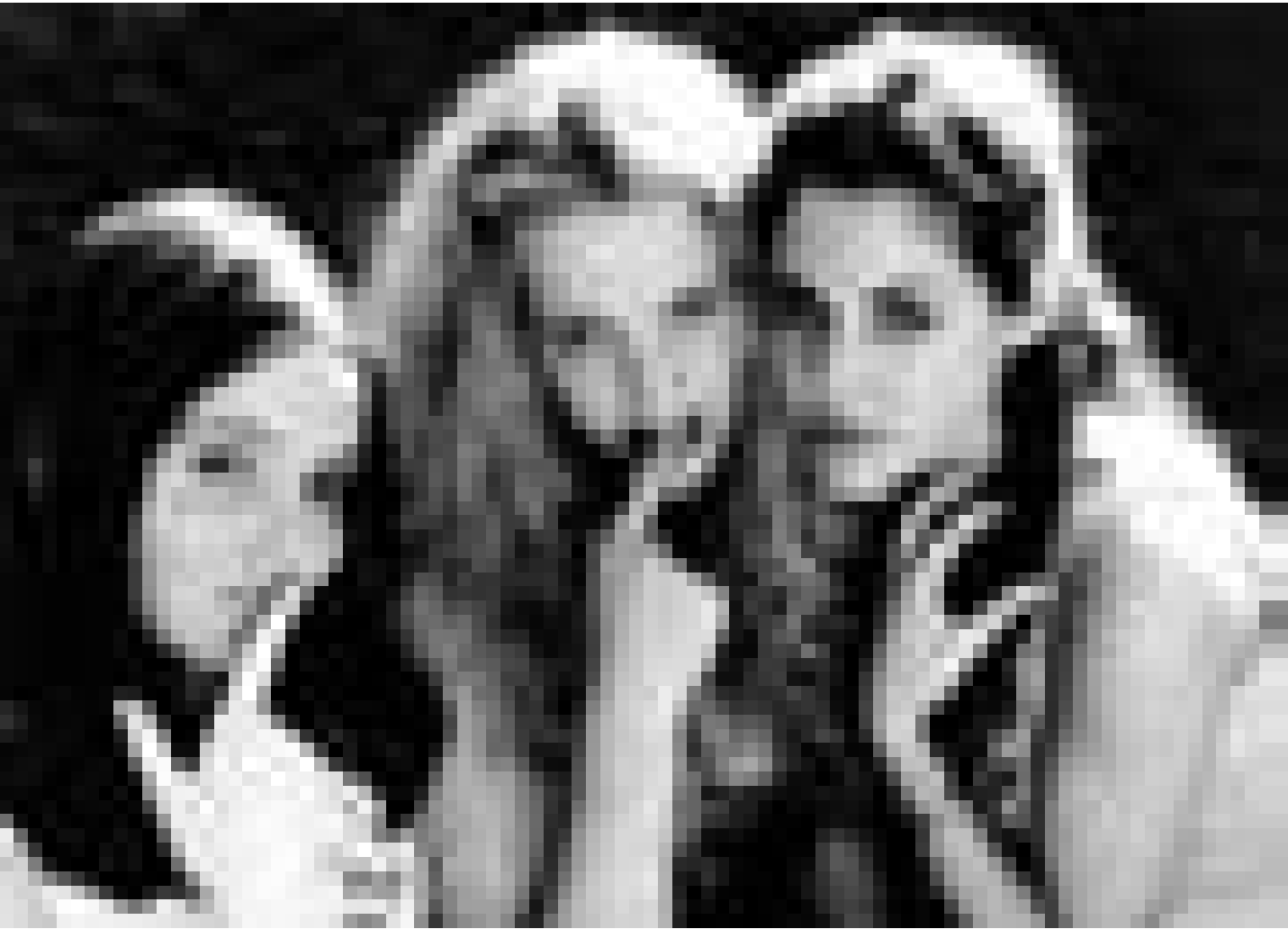
Solange sie ihre Finger nicht in anderer Leute Angelegenheiten stecken ... "Mädchen, Mädchen" von Denis Gansel. Im Utopolis.

de Catherine Breillat. F 2000. Avec Anaïs Rebout et Roxane Mesquida. 93'. V.o.; à p. de 17 ans.