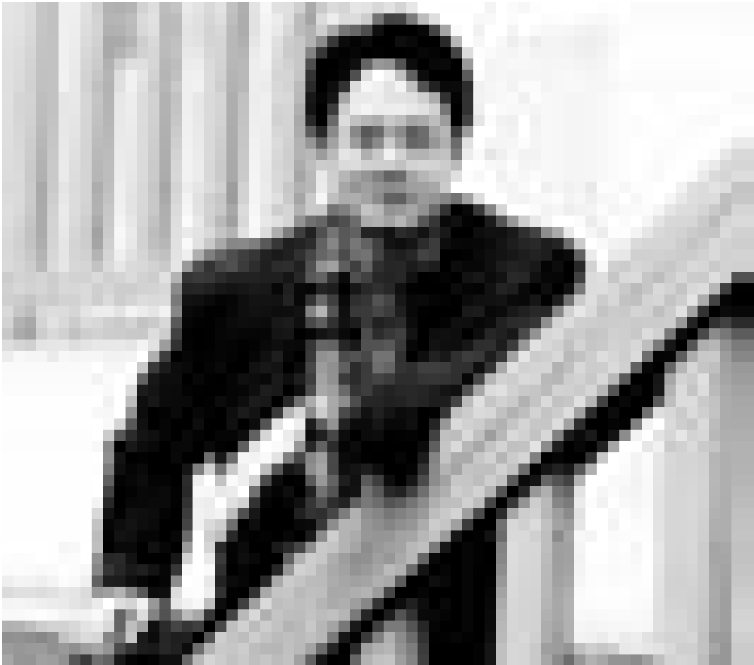
Ce vendredi 1.6. est le dernier jour du "Festival des nouveaux cinémas chinois". Ang Lee (photo ci-dessus) y est représenté avec "Eat Drink Man Woman" de l'année 1994. Le film est montrée aujourd'hui vendredi à 18h30.