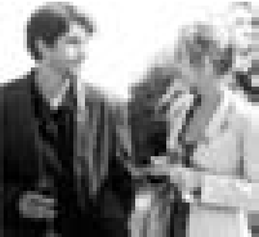
Voulez-vous coucher avec moi? Jacques Gamblin et Sandrine Bonnaire dans "Mademoiselle" de Philippe Lioret. Nouveau à l'Utopia.

Chuckie, l'un des Razmoket, veut une nouvelle maman et son père cherche une femme ... ce qui est