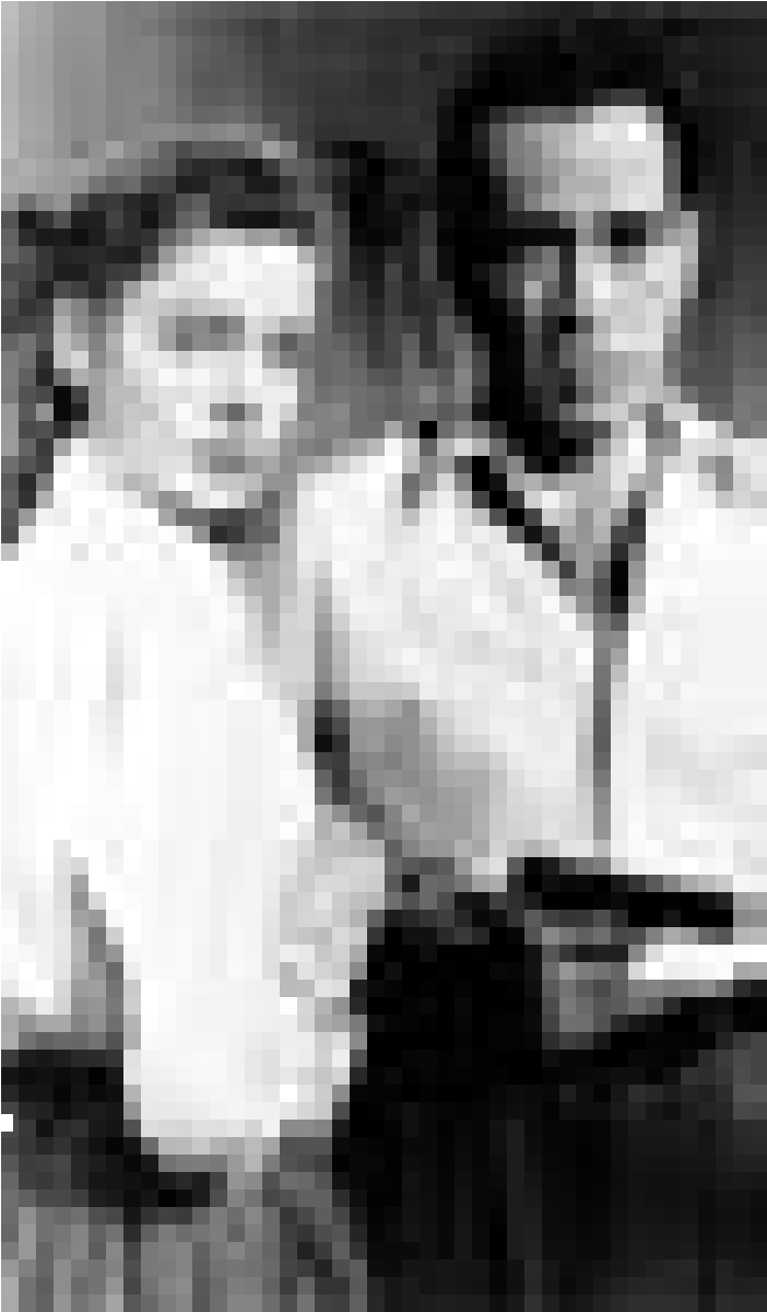
Lauren Bacall et Humphrey Bogart, un couple légendaire en toutes circonstances. A la Cinémathèque samedi 2.6. à 22h30 "Key Largo" de John Huston.

Paul et Mary Bland sont un charmant couple de petits-bourgeois qui rêvent d'ouvrir un petit restaurant. Mais ils ont plein d'ennuis et de plus ils sont constamment dérangés par un groupe de partouzeurs qui se réunissent à l'étage au-dessus. Paul et Mary ont bien entendu horreur de toute sexualité débordante. Le