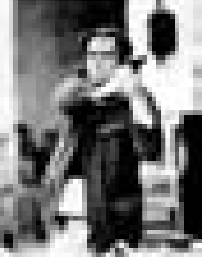
Un pistolet pointé en direction des ennuis ... "The Way Of The Gun" de Christopher McQuarrie. Nouveau à l'Utopolis.