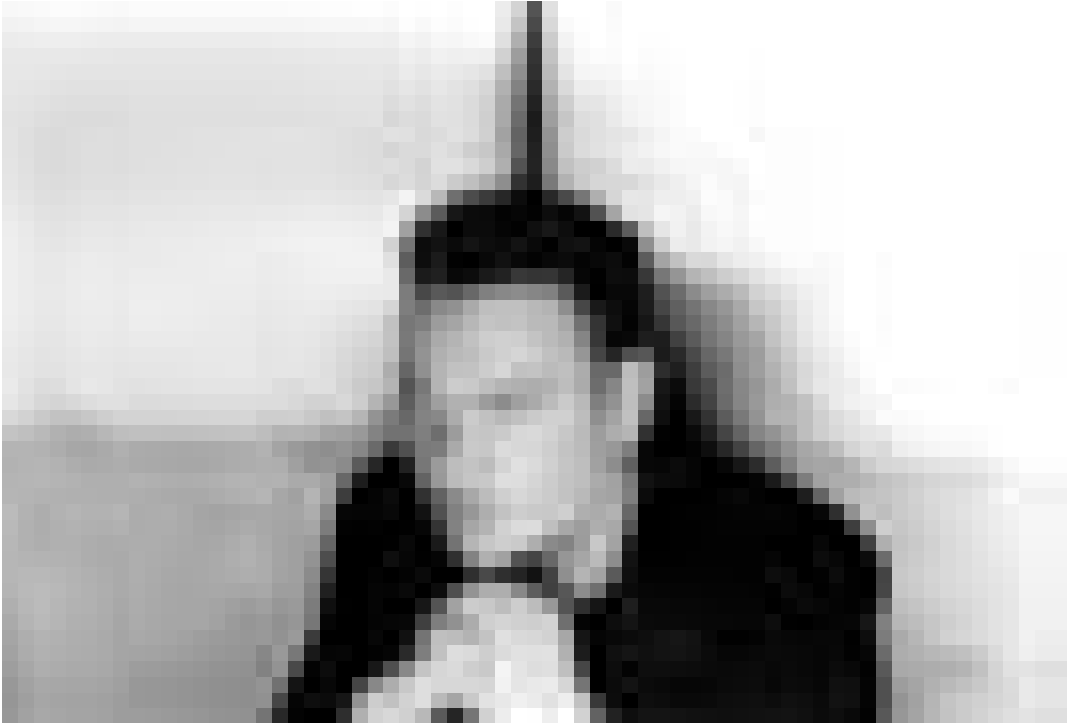
Kreiert Songs mit Ohrwurmcharakter: NEK alias Filippo Neviani.