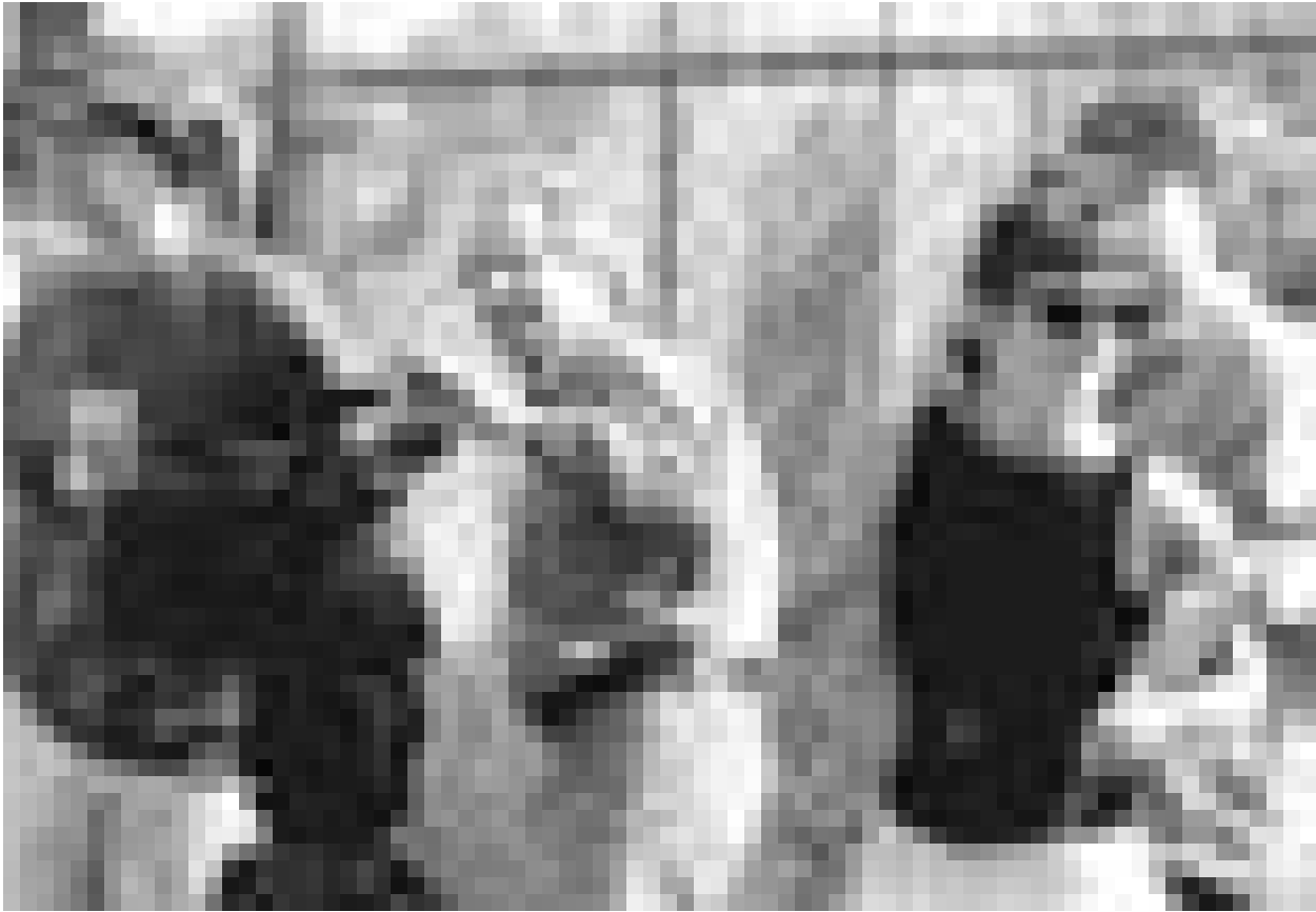
"Encore un peu plus à gauche." Ken Loach, réalisateur politique, en action.

Im Rahmen seiner Deutschland-Tournee macht der blauäugige Filippo Neviani aus der Emilia Romagna, zum zweiten Mal in Luxemburg Station, um sein aktuelles Album "La vita è" vorzustellen. Die Scheibe verspricht das erfolgreichste Werk des vor allem nördlich der Alpen gerne als Teenie-Schwarm vermarkten Italieners zu werden. Nach über fünf Millionen weltweit verkauften Alben hat NEK es geschafft, seinen Musikstil, der durchaus nicht nur die jüngeren weiblichen Fans anspricht, weiterzuentwickeln