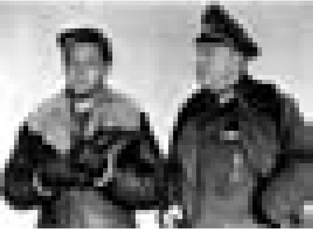
William Holden et Otto Preminger dans "Stalag 17" de Billy Wilder. Mercredi à la Cinémathèque.