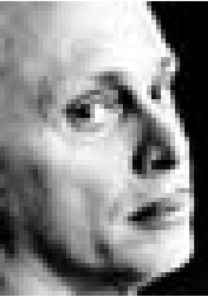
Incompris ou simplement rejeté: John Waters n'a pas eu de succès au Luxembourg avec son film "Cecil B. Demented". Après une semaine le film a disparu de la programmation de l'Utopia.

De toute évidence, son film fera moins de vagues que ce qu'il aurait pu croire. Les clichés, l'humour pas très relevé et l'interprétation pas toujours convaincante des différents protagonistes pourraient bien en être la cause. Du côté de la mise en scène, nous n'avons pas trop de choses à redire. Le rythme est bon, empêchant le spectateur de s'assoupir, mais l'intrigue est un peu mince et, franchement, on n'a que faire du destin de ce jeune réalisateur qui a la