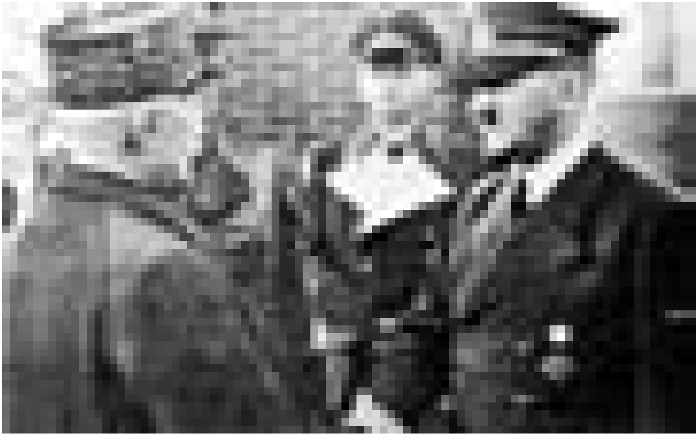
Quand Pétain rencontre Hitler ... Sur une proposition du Goethe Institut de Paris et à destination des jeunes des collèges et des lycées, l'Arsenal à Metz accueille une exposition consacrée à la periode de 1939 à 1945, au travers d'un questionnaire de 22 témoins qui avaient à peu près leur âge à cette époque. "Traces de Mémoire", jusqu'au 20 mars à la Galerie de l'Arsenal.

aquarelles et glacis, Galerie Weber (7, rue des Tondeurs, tél.: 95 72 36), jusqu'au 25.3., ve. - di. 15h - 18h.