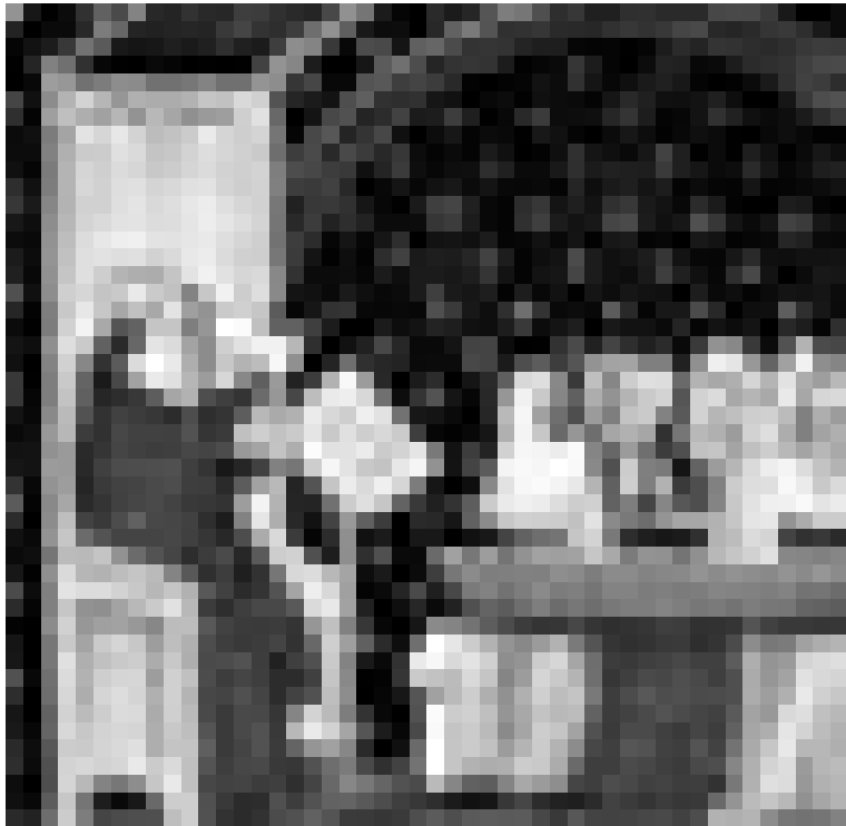
Leçon sur l'arc-en-ciel dans une classe du moyen âge.

Notre siècle des sciences donne l'impression que la matière résumée à ses composantes constitutives les plus minuscules connues est invariable.