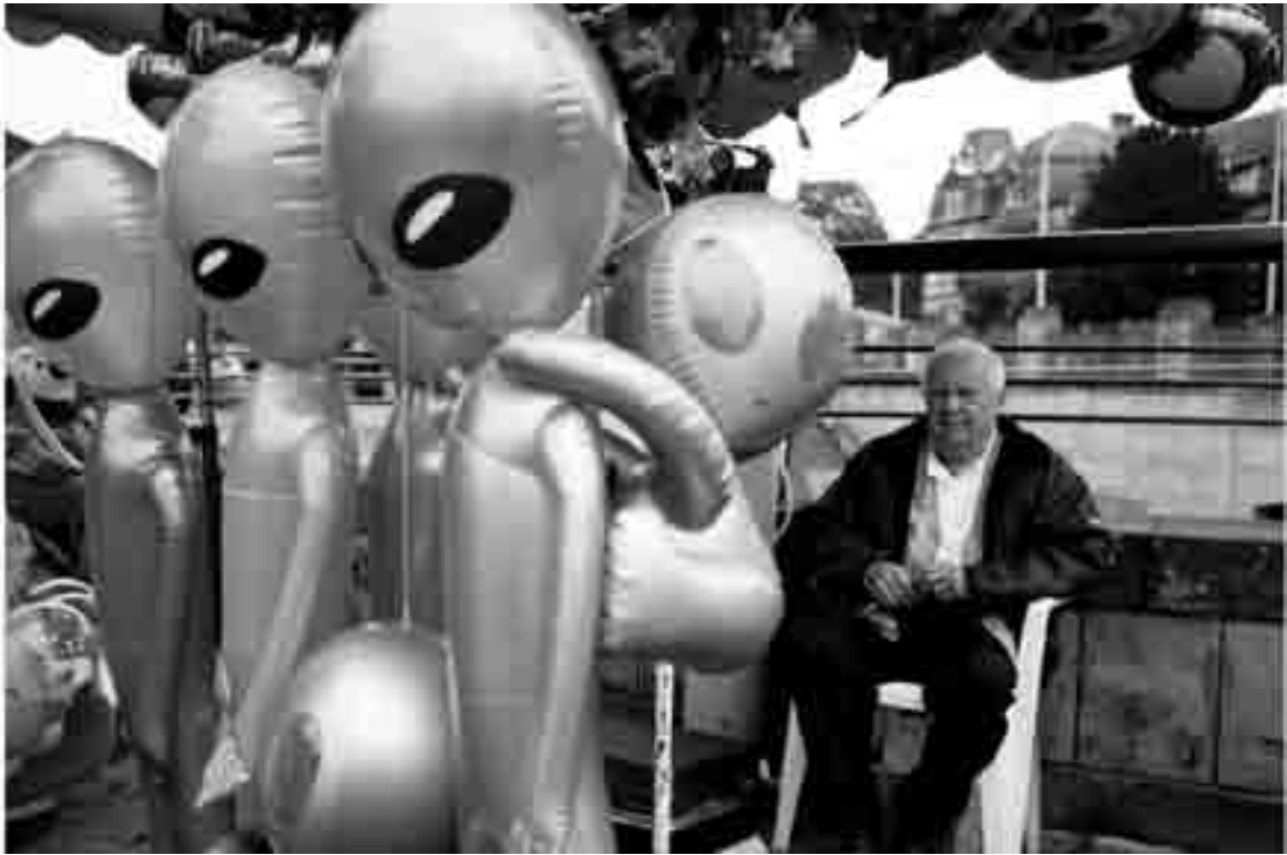
Toutes sortes de personnages plus ou moins hauts en couleurs se retrouvent chaque année à la Schueberfouer.