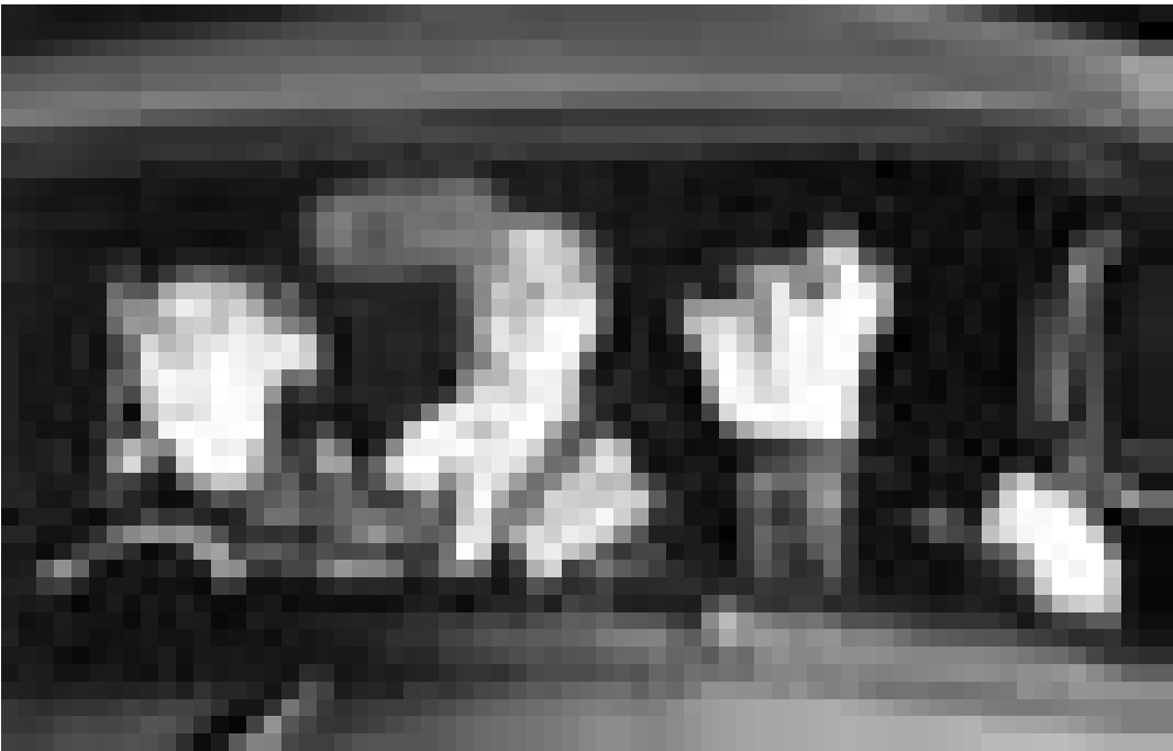
Quelqu'un dans cette voiture a oublié quelque chose. "The Man Without a Past" d'Aki Kaurismäki. Nouveau à l'Utopia.