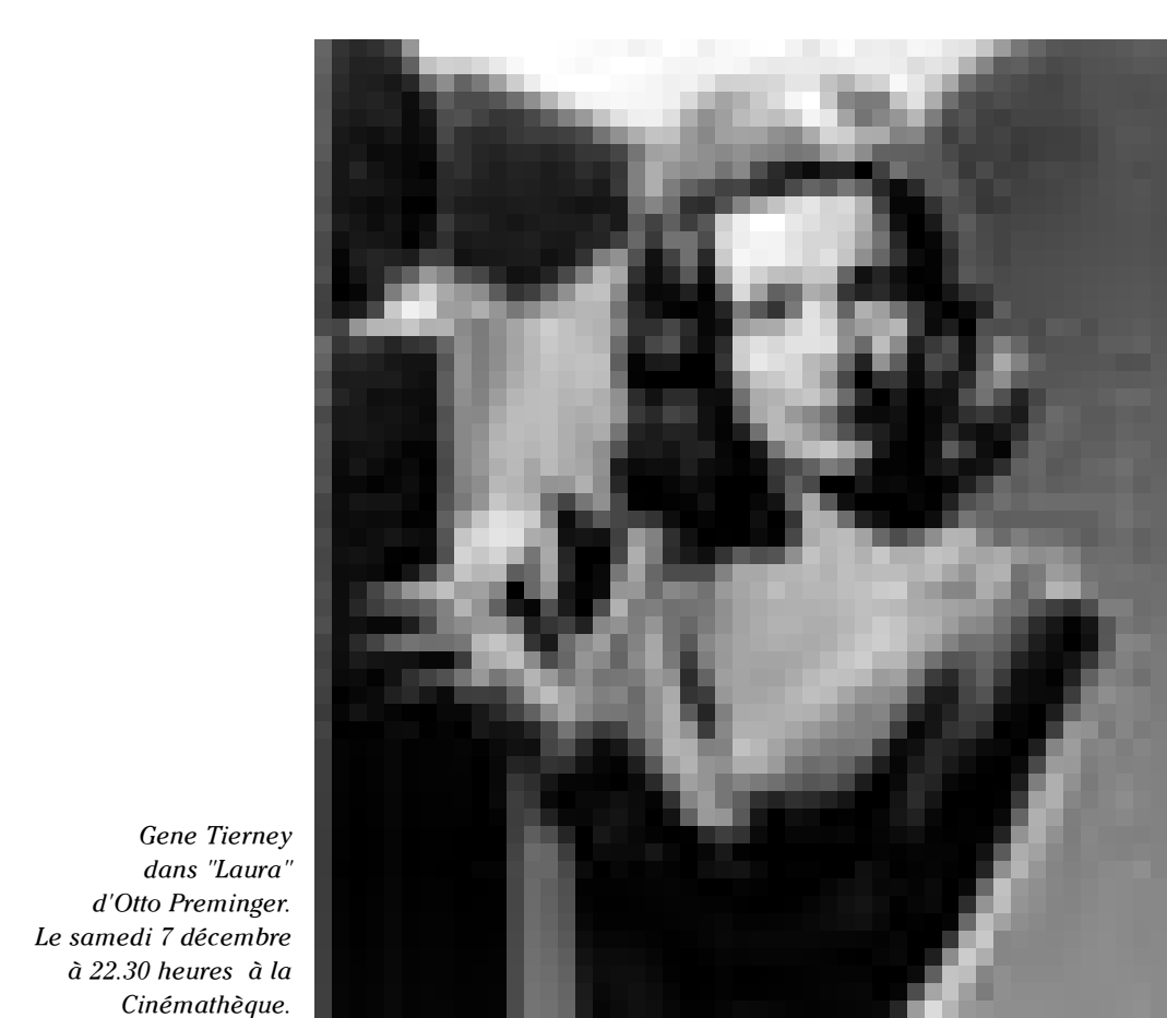
Gene Tierney dans "Laura" d'Otto Preminger. Le samedi 7 décembre à 22.30 heures à la Cinéma thèque.

Quelques épisodes des aventures du chevalier Don Quichotte de la Manche et de Sancho Pança, son fidèle écuyer, dans l'Espagne contemporaine du tournage du film. Inachevé, ce film est montré ici au travers des rushes de la Cinéma thèque Française.