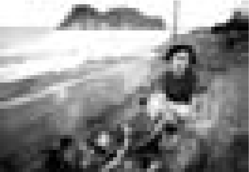
Keisha Castle-Hughes dans "Whale Rider" de Niki Caro

Dans un village côtier de la Nouvelle-Zélande, la jeune Pai devient la première femme cheffe des "Whale Rider", une tribu maori.