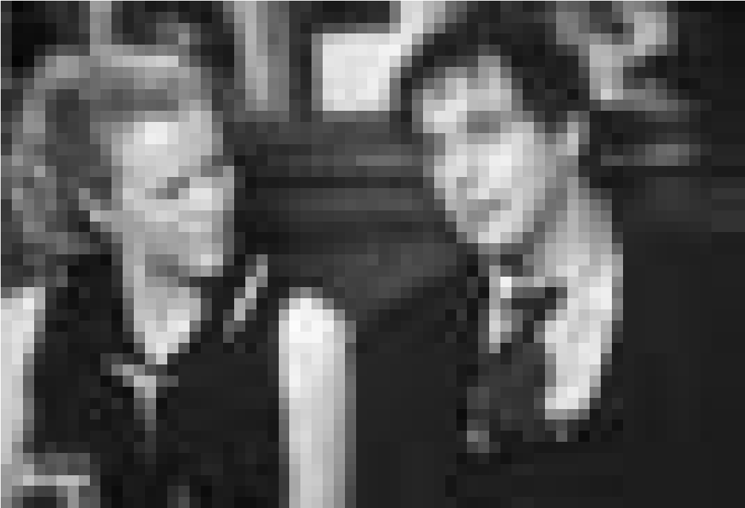
De nouveau ... une nouvelle chevelure pour Al Pacino (à droite) dans "People I know" de Dan Algrant, ensemble avec Kim Basinger (à gauche). Nouveau à l'Utopolis.