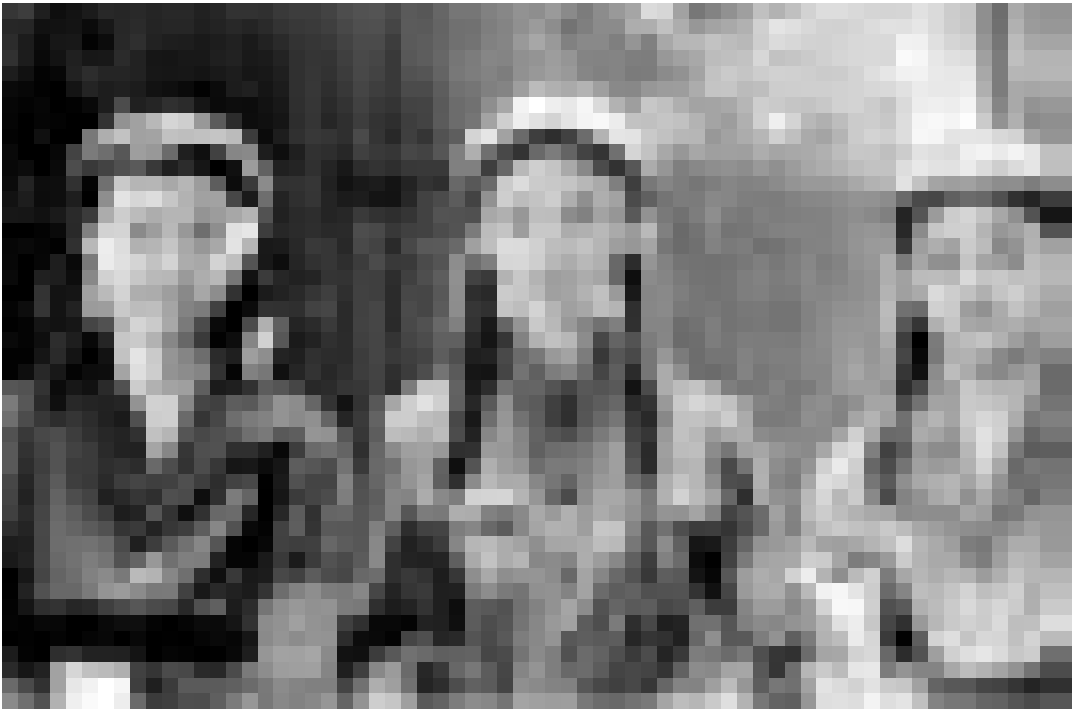
Rééducation dans la Chine maoïste pendant la révolution culturelle ... "Balzac et la petite tailleuse chinoise" de Dai Sijie. Nouveau à l'Utopia.