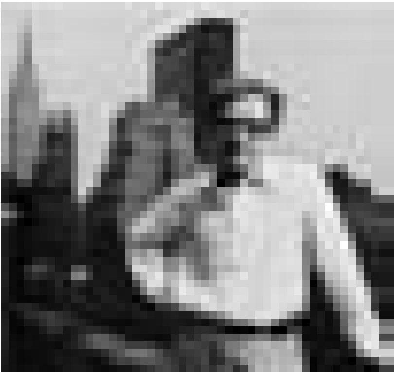
Un vrai New

Tandis que Scorsese ("Life Lessons") nous fait vivre les affres d'un peintre adulé que sa maîtresse veut quitter, ce qui paralyse totalement la fibre créatrice de l'artiste, et que