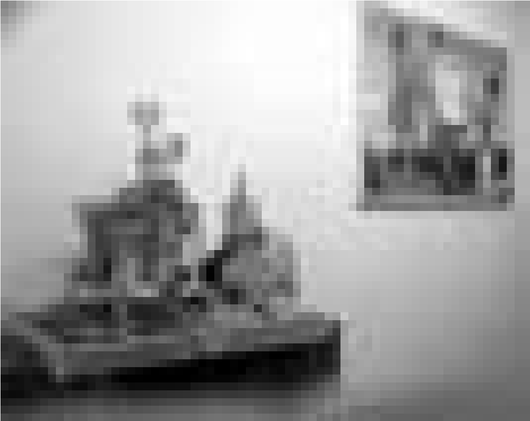
"Hotel de Ville - Kinshasa". Eine Konstruktion aus Fundstücken des afrikanischen Künstlers Isek Body Kingelez. Ebenfalls zu sehen im Rahmen der Ausstellung "Luxurious" in der Galerie Clairefontaine - Espace 2.

Bis zum 26. Juli in der Galerie Clairefontaine, Espace 2.