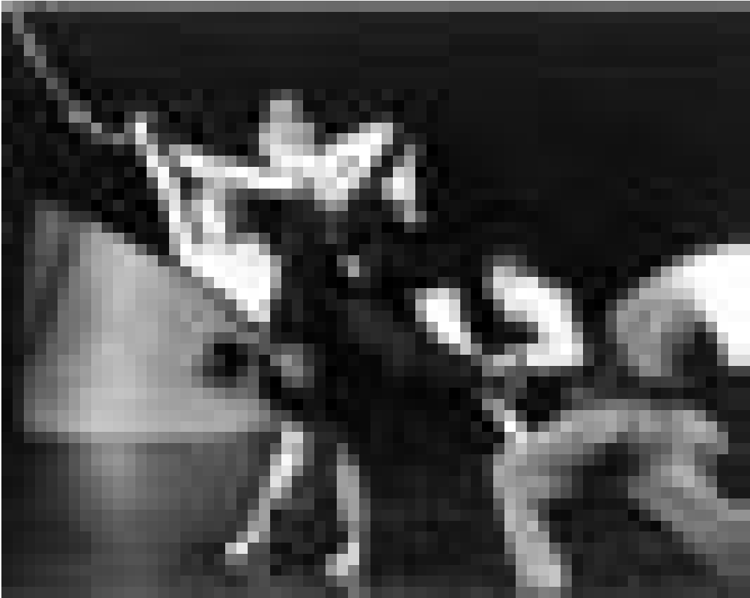
Entre danse contemporaine et cirque: "Animal regard". Le 10 janvier au Studio du Grand Théâtre, Luxembourg.

Seychelles - Maurice: triomphe de la nature, par Claude Pavard, Conservatoire, Luxembourg, 20h. Dans le cadre de l'Exploration du Monde. Tél. 47 08 95.