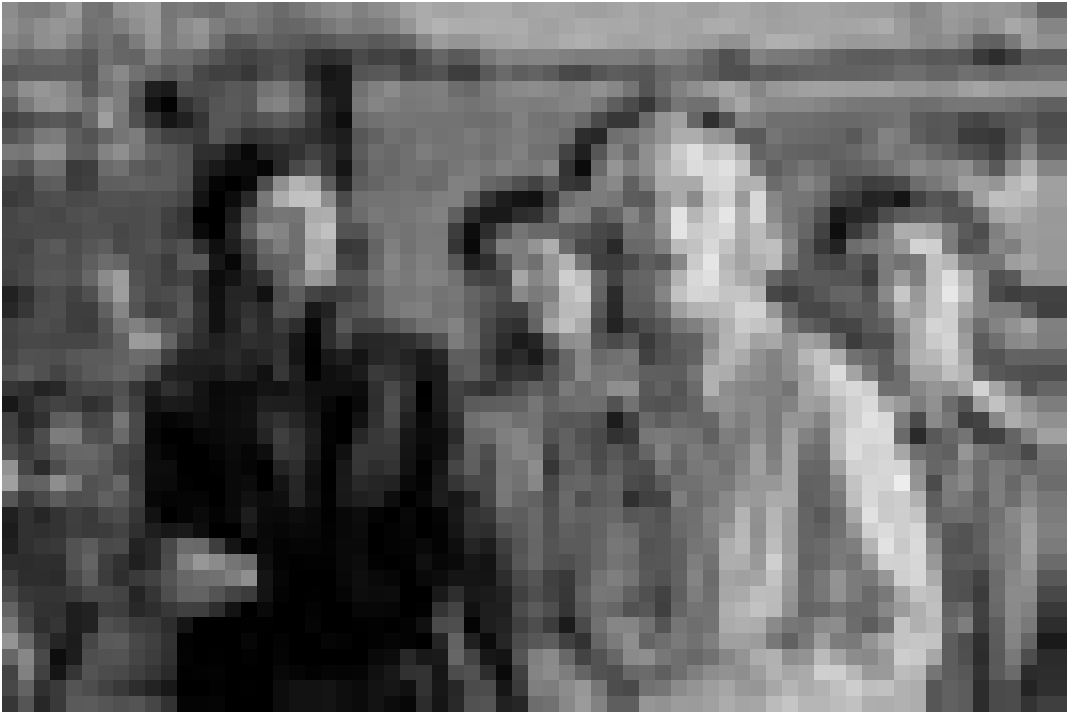
All American Girls: Julia Roberts en prof éclairée dans "Mona Lisa Smile". Nouveau à l'Utopolis.