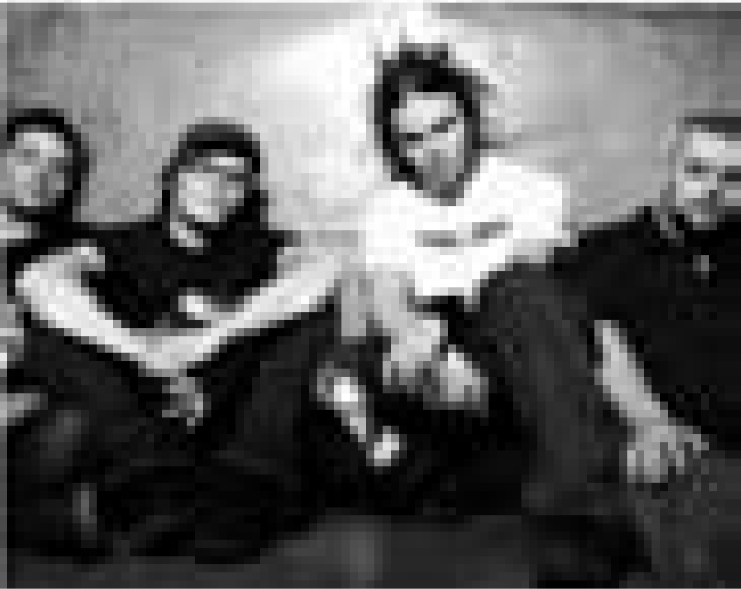
Aus dem hohen Norden: "The Rasmus". Am 2. Februar im Atelier.

contemporain, Luxembourg , 18h. Tél. 22 50 45.