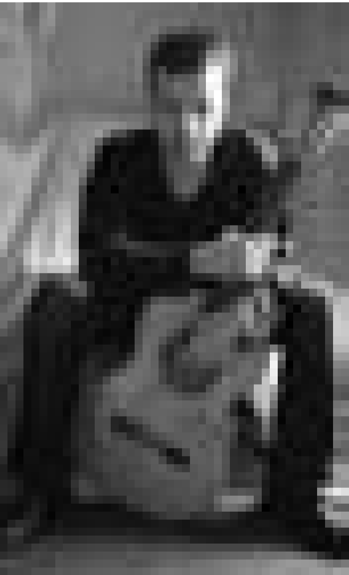
Flamenco d'aujourd'hui: Jaume Tugores passe à la Villa Louvigny ce samedi 31 janvier.

A 12 1/3 (and even more) Year Survey , visite guidée thématique: "De la réalité au mythe", Casino Luxembourg - Forum d'art