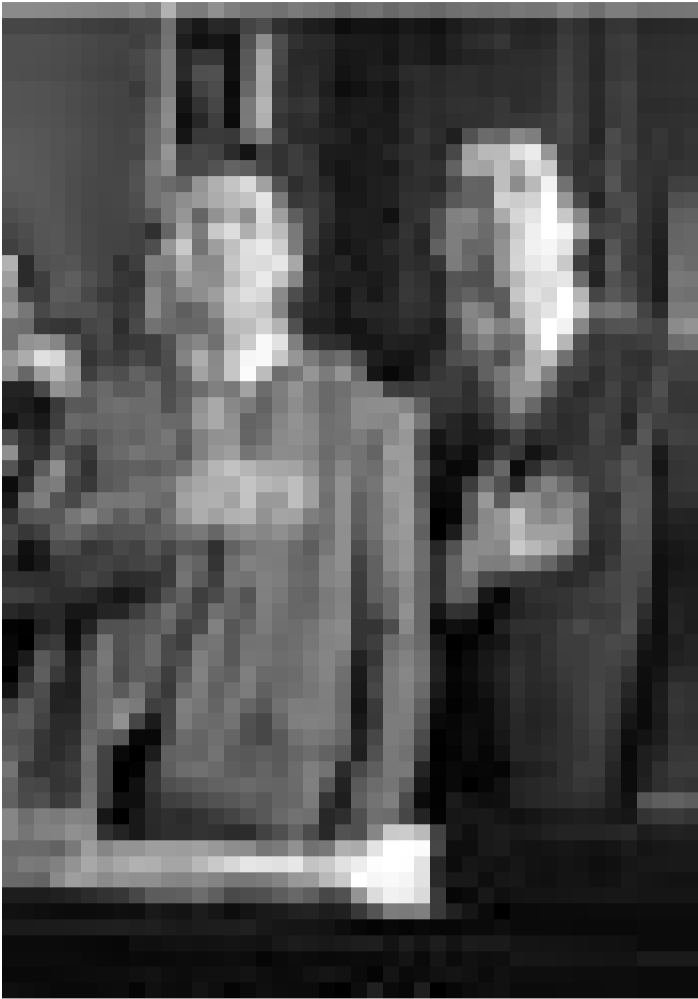
Hand auf's Herz: Ist das Buch nicht besser? "Runaway Jury" ein Film von Gary Felder nach dem gleichnamigen Roman von John Grisham.Neu im Utopolis.

Entre Jerry, jeune écrivain comique, et Amanda, ça a été le coup de foudre. Et pourtant ... pas si simple la vie au jour le jour avec Amanda, un peu névrosée, boulimique, jamais ponctuelle ... Pas facile non plus de se séparer de son agent quand on est son unique client, dur de partager son appartement avec sa belle-mère ... heureusement il y a Dobel, un confrère qui a un avis sur tout ... XXX Dans son 33e long-métrage, Woody Allen renonce au rôle "principal", et c'est une aubaine. C'est qu'il s'en donne à coeur joie en gentil terroriste, même si, une fois n'est pas coutume, il n'embrasse pas ... (sgl)