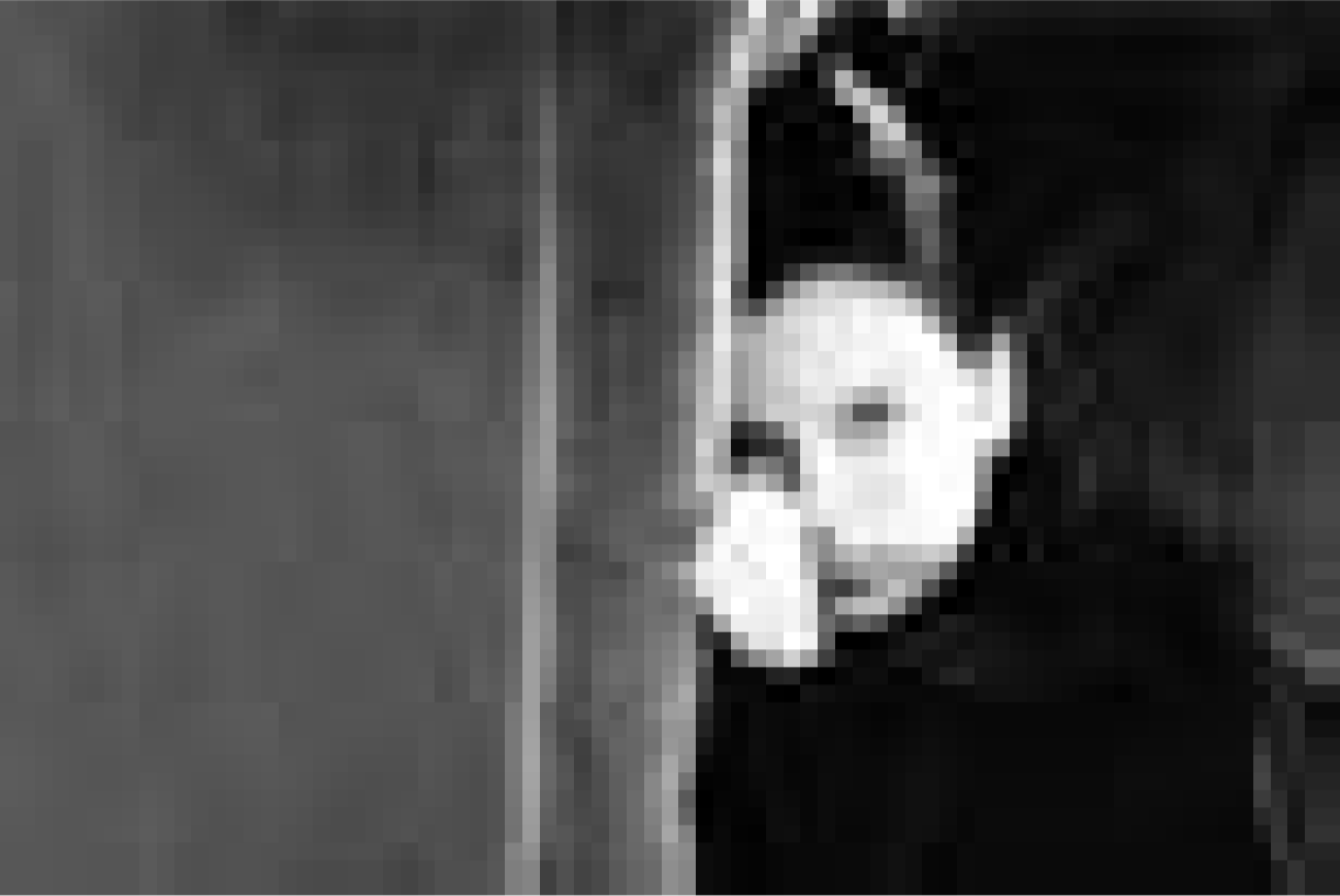
Frauen sind anders, auch beim Sterben: "My Life Without Me" von Isabel Coixet. Zu sehen im Utopia.