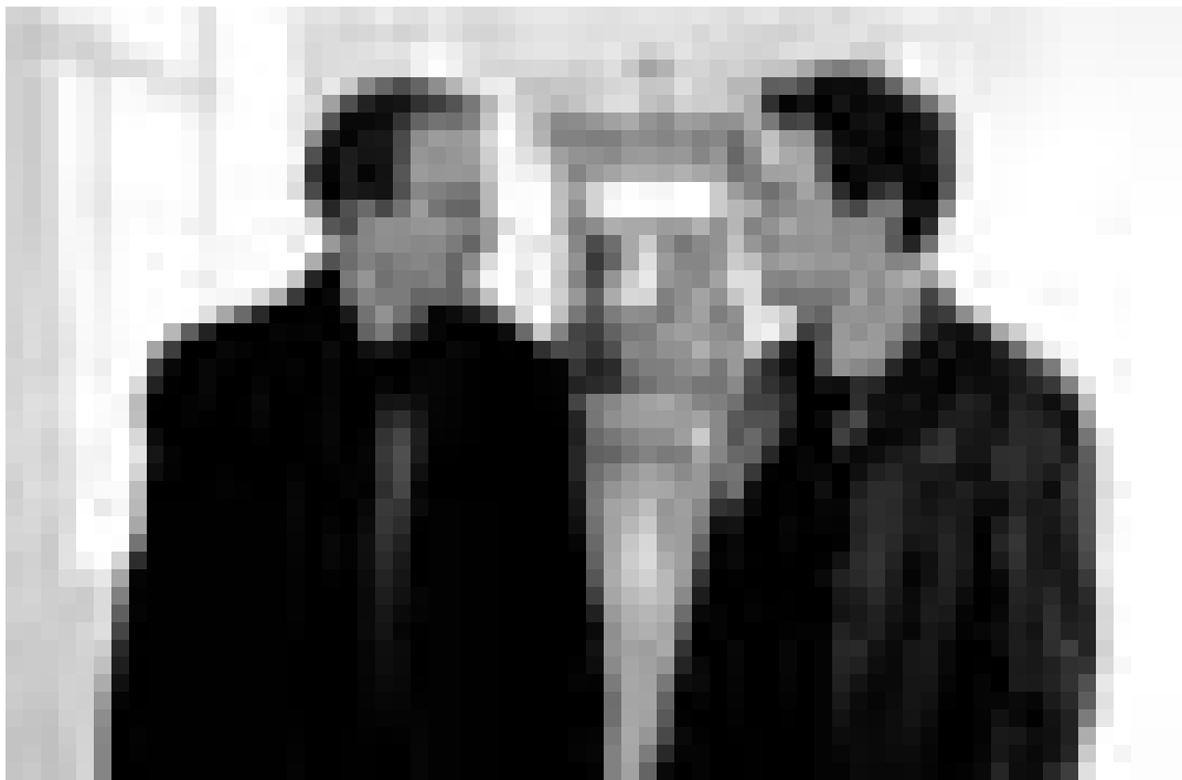
Deux frères aux antipodes: Harbour (Adrian Rawlins) et Wilbur (Jamie Sives).