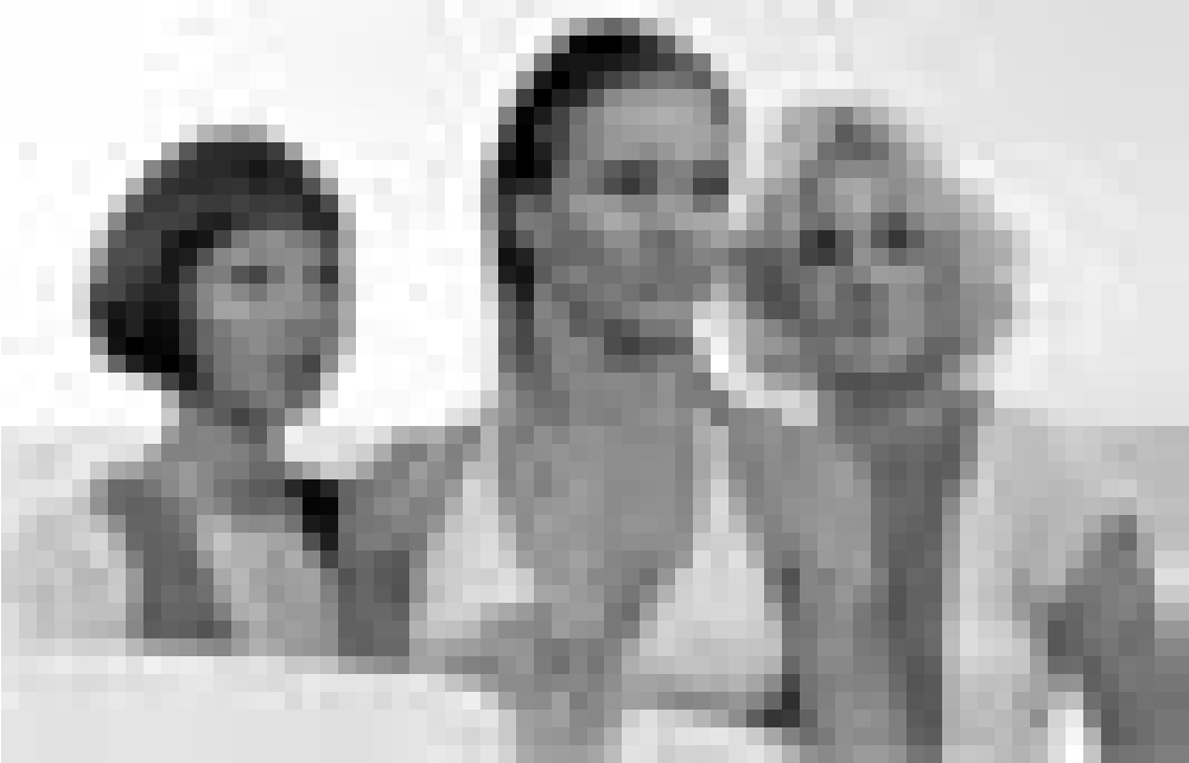
Les trois armes secrètes de Charlie ... Lucy Liu, Cameron Diaz et Drew Barrymore dans "Charlie's Angels 2: Full Throttle" de McG. Avant-première jeudi à l'Utopolis.