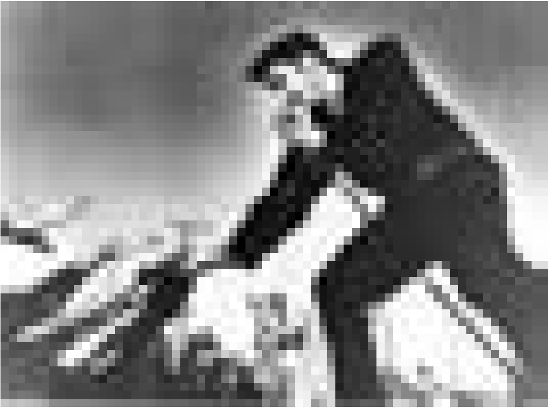
"Memories - a tribute to the King" nennt Steven Pitman seine Multi-Media Performance, um "King" Elvis. Am 6. September in der "Brasserie L'Inoui".

Récital d'orgue , par Paul Kayser, Cathédrale, Luxembourg, 11h.