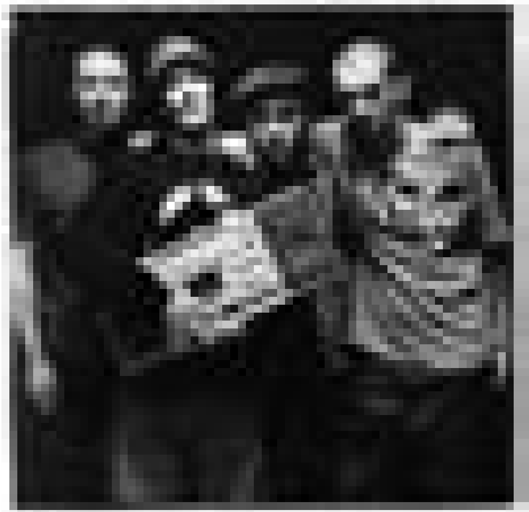
"Le Peuple de l'Herbe" jouera le 7 septembre au "Festival Terres-Rouges".

Der Weg der Raod-Map - Friedensstraße oder Sackgasse? Vortrag von Avi Primor, Stiftung Demokratie