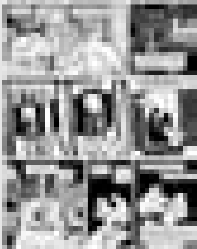
L'ouvrage, en noir et blanc, est agrémenté de nombreux croquis inédits de l'auteur, jamais avare de révéler la matière première de son travail. (Illustrations: © 2001 Dargaud, n.v.)