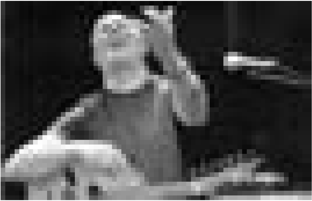
Komponist, Vokalist und Oud-Spieler - seine Vielseitigkeit und seine Verwurzelung mit der islamischen Mystik, der Sufi-Tradition, machen ihn zu einem der interessantes World-Jazz-Musiker: Dhafer Youssef. Am Mittwoch, den 24. März in Melusina in Luxemburg.

Cancer de l'Intestin: de la prévention au traitement , par Dr