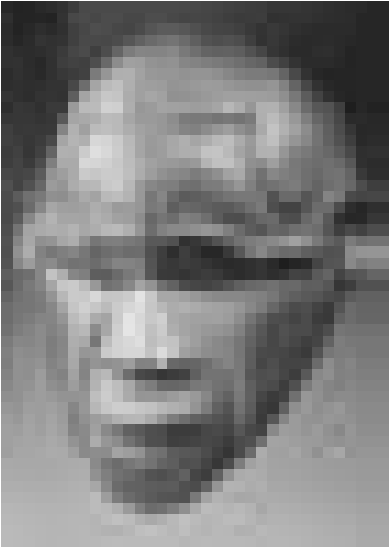
Masque okua, Nigéria

Signes du corps (RK) Vous trouvez bizarres ces gens qui portent des tatouages ou des piercings? En sortant du musée Dapper à Paris, les frontières entre la "normalité" et la déviance vous paraîtront sans doute moins nettes. L'exposition "Signes du corps" met en évidence la constance avec laquelle des cultures autres que la nôtre ont utilisé le corps comme support d'expressions rituelles et artistiques. La première salle affiche des photographies de corps de contemporain-e-s marqués de différentes manières. A côté de chaque image se trouve un témoignage expliquant la démarche de la personne - ils évoquent moins la destruction du corps par ces marques que la génération d'une identité, voire la renaissance. Le reste de l'exposition fait le tour des "signes du corps" dans différentes civilisations: précolombienne, indienne, mélanésienne et africaine. Elle montre bien que les marquages du corps constituent une valorisation par rapport à un corps immaculé. Malheureusement les textes explicatifs sont trop peu nombreux et n'analysent pas les points communs et les différences entre les multiples pratiques. Pour approfondir la réflexion, l'excellent catalogue est indispensable. L'exposition vaut cependant d'être vue pour elle-même, car ce musée spécialisé en art africain a rassemblé des oeuvres rares et d'une grande valeur esthétique. Jusqu'au 3 avril 2005 Musée Dapper, 35, rue Paul-Valéry, Paris, 16e www.dapper.com.fr