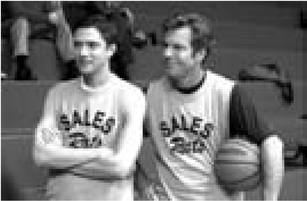
Sie spielen nicht im gleichen Team: Carter (Topher Grace) und Dan (Dennis Quaid) in "In good company". Neu im Utopolis.

Die Geschichte von den drei Geschwistern Baudelaire, die ihre Eltern bei einem Hausbrand verlieren. Sie kommen ins düstere Haus des Grafen Olaf, einem ent-