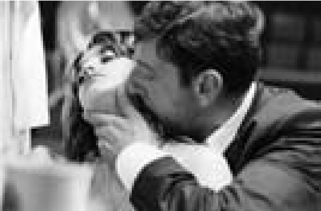
Un chirurgien (Sergio Castellitto) fait la rencontre d'une jeune femme énigmatique (Penélope Cruz) dans "Non ti muovere". Nouveau à l'Utopia.