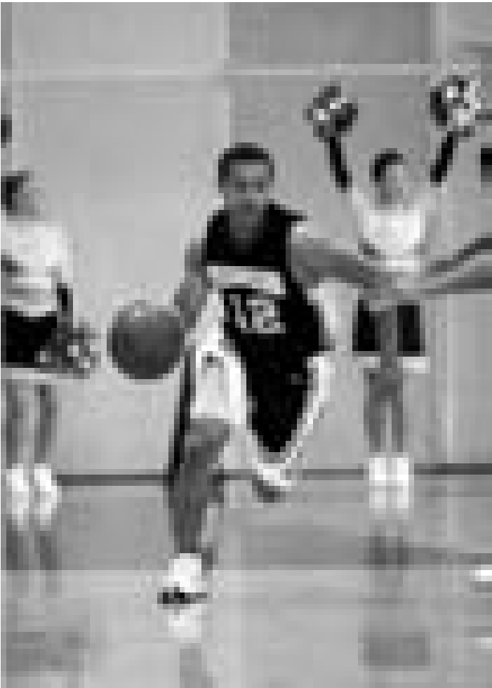
Entraîné par un coach de basket aux méthodes innovatrices. "Coach Carter". Nouveau à l'Utopolis.