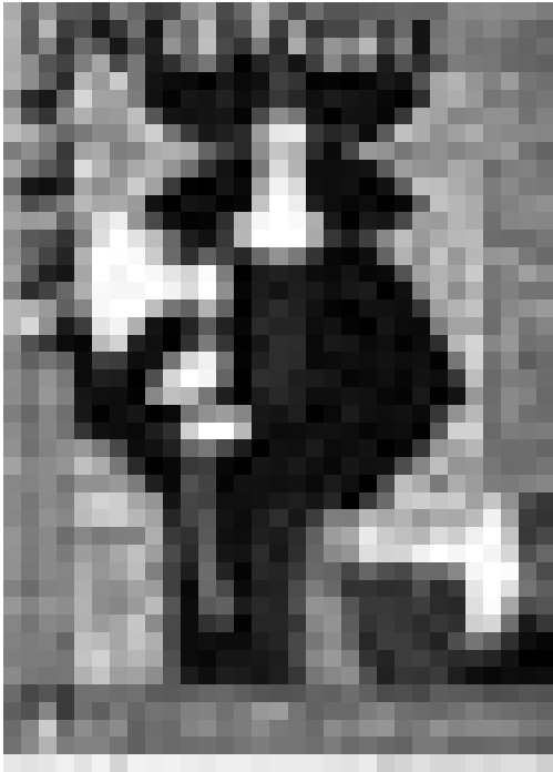
Peter Shaffers "Laura und Lotte", in einer Inszenierung von Renate Ourth ist ab Dienstag, dem 28. Juni um 20 Uhr im Kasematten-theater zu sehen.

Tout va bien , One man show avec Alain Holtgen, Art Café (cour du Théâtre des Capucins), Luxembourg, 20h30. Tél. 26 20 36 20.