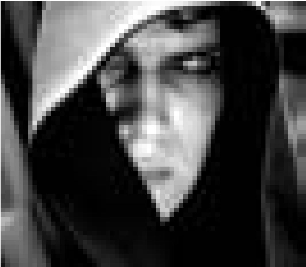
L'éclaircissement du mystère ... Hayden Christensen dans "Starwars - Episode III: Revenge of the Sith" de George Lucas. A l'Utopolis (7e semaine)..