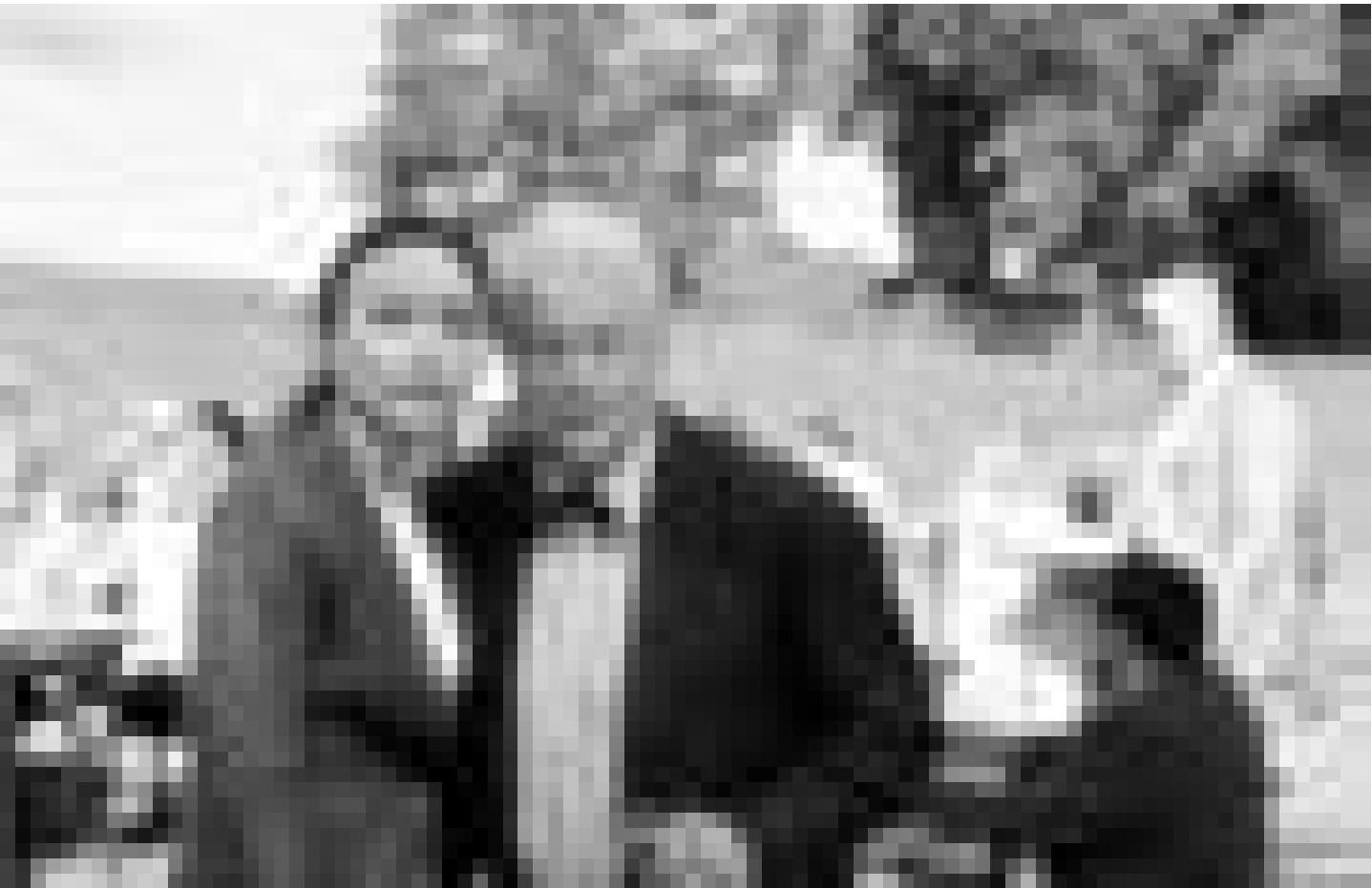
Catherine Frot et André Dussolier se lancent à la recherche d'une mamie en vadrouille dans "Mon petit doigt m'a dit". Nouveau à l'Utopia.

(*) les candidat(e)s pour les fonctions d'enseignant(e)s pour les professions de santé (E7 et E5) doivent avoir, outre la qualification professionnelle ou académique, le droit d'exercer la profession respectivement d'infirmier, d'ATM de radiologie, d'infirmier en pédiatrie, d'ATM de chirurgie. Les demandes sont à présenter au moyen d'un formulaire d'inscription spécial disponible auprès du Ministère de l'Education nationale et de la Formation professionnelle, 29, rue Aldringen, L-2926 Luxembourg, pour le 15 juillet 2005 au plus tard. Les candidat(e)s doivent avoir une connaissance adéquate des trois langues administratives (luxembourgeois, allemand et français). La limite d'âge est fixée uniformément à moins de 45 ans accomplis au moment de l'admission au stage. Les formulaires d'inscription ainsi que les informations supplémentaires peuvent être obtenus auprès du ministère à partir du 6 juin 2005 (tél. 478 5150 - 478 5131 - 478 5266 - 478 5124).