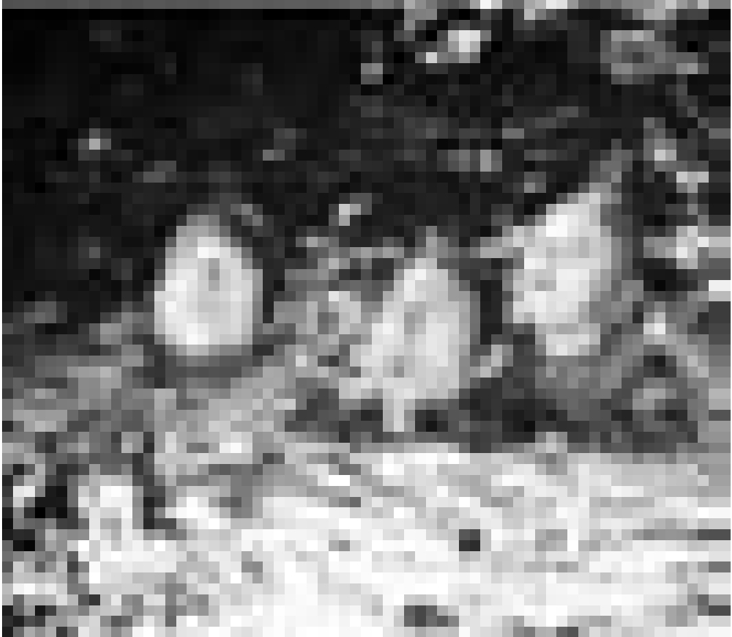
Hier wird nicht zum Spaß geschwommen ... Tom Cruise und Dakota Fanning in "War of the Worlds" von Steven Spielberg. Im Utopolis, im Ariston (Esch) und im Kursaal (Rumelange).