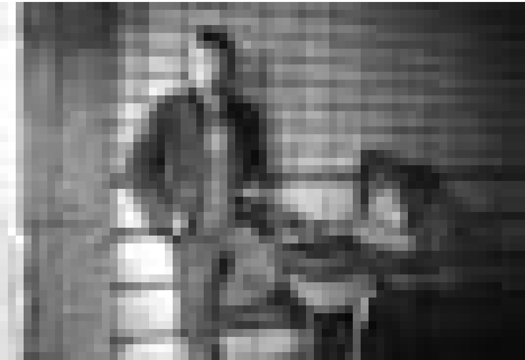
Il n'a pas l'air de vraiment savourer son rôle de jeune papa. Jérémie Reinier dans "L'enfant", film couronné par la palme d'or 2005. Avant-première en présence des réalisateurs le mercredi 14 septembre à l'Utopolis.