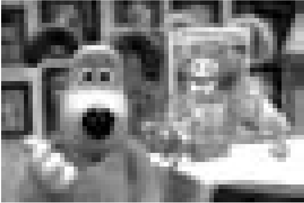
Gromit et Wallace dévorent du "Chester" à la cinémathèque le mercredi 14.9. à 20h30.

Il s'en passe de belles, dans cette antenne chirurgicale en pleine guerre de Corée où sévissent