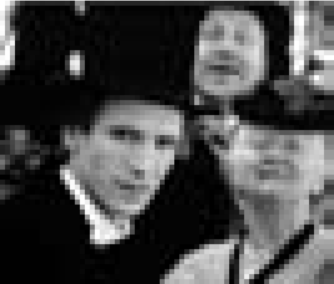
D'après le roman de Peter Carey: "Oscar and Lucinda" de Gilliam Armstrong, avec Ralph Fiennes. Samedi à la Cinémathèque.

leurs forces pour créer un ordre nouveau par la terreur. Au-delà de la description d'un pouvoir psychique effroyable, au-delà du premier degré de ses côtés spectaculaires, "Scanners" est une parabole sur la lutte du Bien contre le Mal.