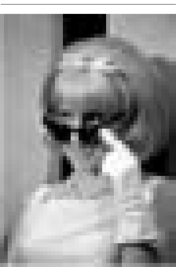
Attention! Innocence dangereuse! Sue Lyon dans "Lolita" de Stanley Kubrick. Vendredi à la Cinémathèque.