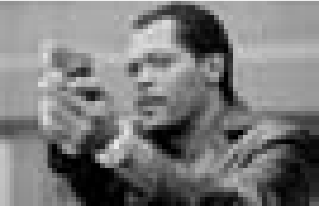
Special-Agent Derrick Vann bei der Arbeit. Samuel L. Jackson in "The Man" von Les Mayfiled. Neu im Utopolis.

USA 2005 von Richard Shepard. Mit Pierce Brosnan, Greg Kinnear und