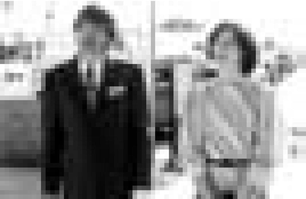
Zwei die sich nahe kommen. John Hawkes und Miranda July in dem von ihr inszenierten Film "Me and You and Everyone We Know". Neu im Utopia.