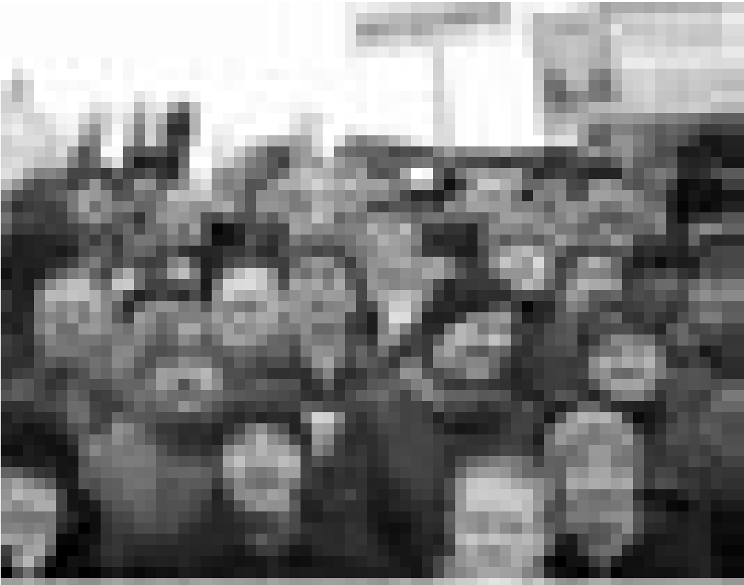
AnhängerInnen der Opposition bei der Wahlregistrierung in Minsk.

Vor den Wahlen setzt Präsident Lukaschenko im Umgang mit politischen Gegnern wie gehabt auf Repression. Seine Bestätigung im Amt gilt indes als sicher.