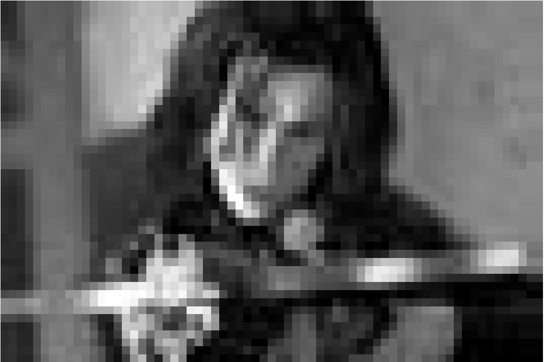
Sélène, la belle guerrière vampire. Kate Beckinsale dans "Underworld Evolution" de Len Wiseman. Nouveau à l'Utopolis.