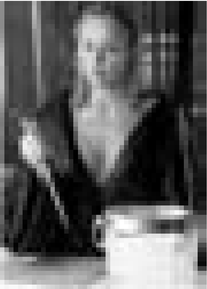
Soupçonnée du meurtre de son fiancé. Sharon Stone dans "Basic Instinct 2: Risk Addiction" de Michael Caton-Jones. Avant-première jeudi à l'Utopolis.