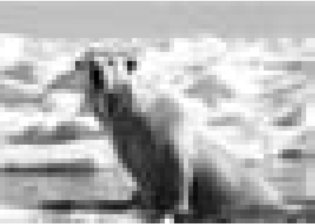
"La planète blanche" un documentaire de Thierry Piantanida et Thierry Ragob avec Jean-Louis Etienne, comme narrateur, explorateur spécialiste des régions polaires. Nouveau à l'Utopia.