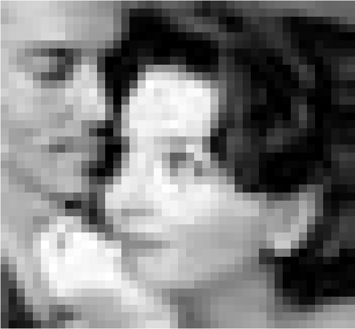
Vianne Rocher séduit avec ses chocolats. Johnny Depp et Juliette Binoche dans "Chocolat" de Lasse Hallström. Samedi à la Cinémathèque.