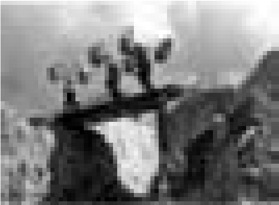
Gefährliche Plackerei auf Java. "Working Man's Death" Dokumentarfilm von Michael Glawogger über Schwerstarbeit in verschiedenen Ländern der Welt. Neu im Utopia.