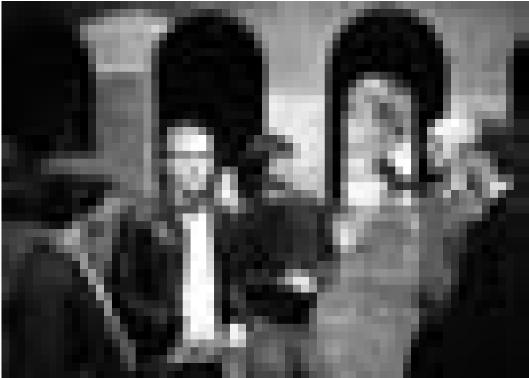
Die Gruppe Tomte.