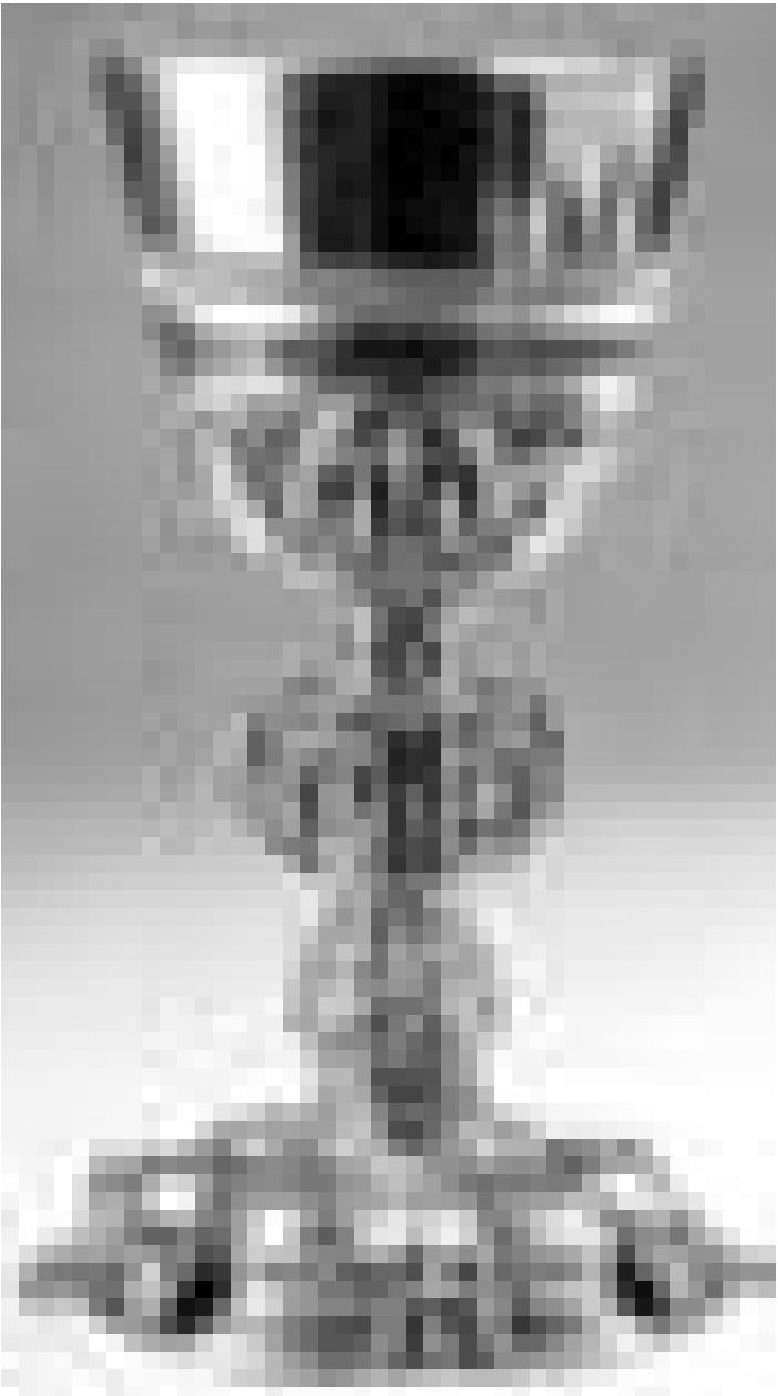
Hier ist alles Gold was glänzt: Kelch aus der Sammlung Sigismunds.

Sigismund von Luxemburg - König und Kaiser (1387 - 1437) Ausstellung 14 Juli - 15 Oktober 2006 Musée nationale d'histoire et d'art Luxembourg