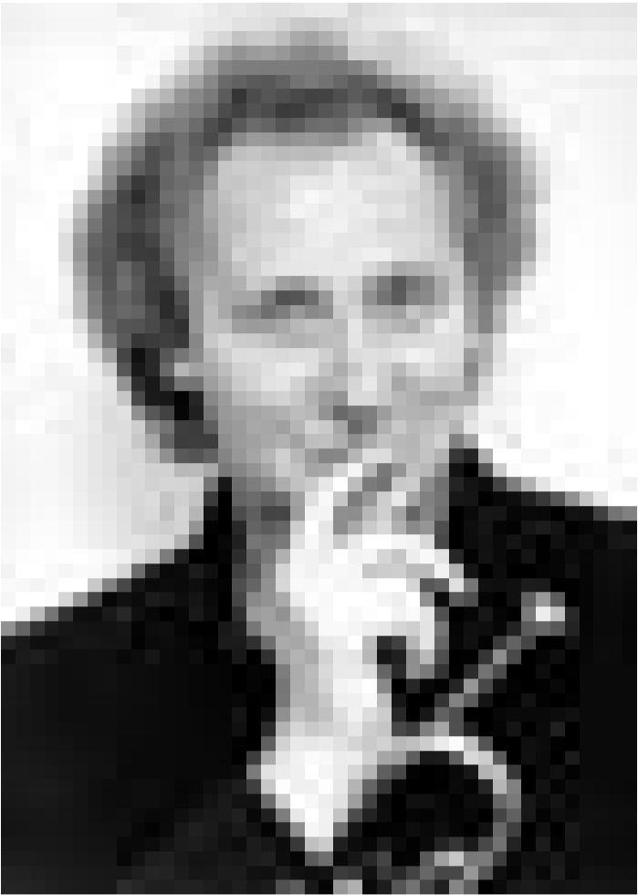
Dans le cadre du Festival d'Echternach, le trompettiste Reinhold Friedrich se produira ce vendredi, 3 juin, à 20h30 dans la Basilique d'Echternach.

Papageno spielt auf der Zauberflöte , eine musikalische Unterhaltung für Kinder von 5-10 Jahren, Théâtre National du