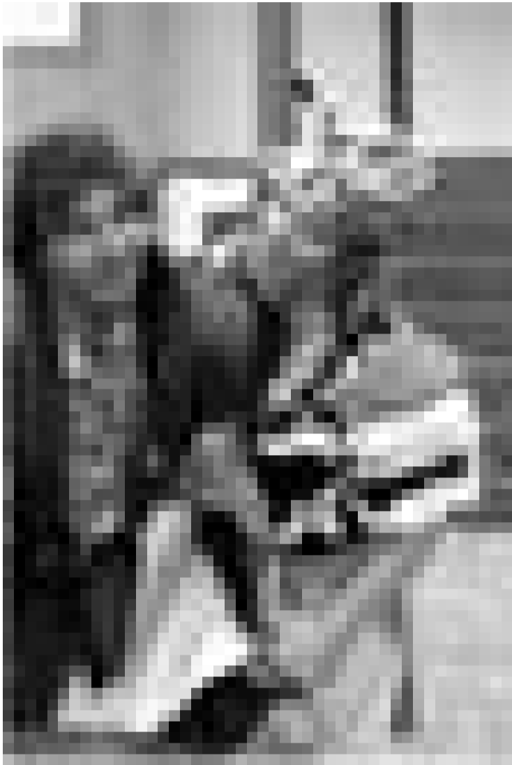
Den Till Eilespigel kritt se all drun.