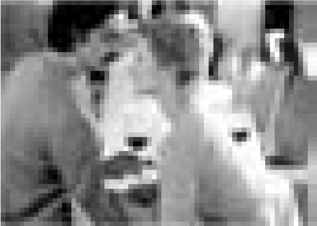
Les chemins sinueux d'une passion amoureuse ... Joan Allen et Simon Abkarian dans "Yes" de Sally Potter. Nouveau à l'Utopia.