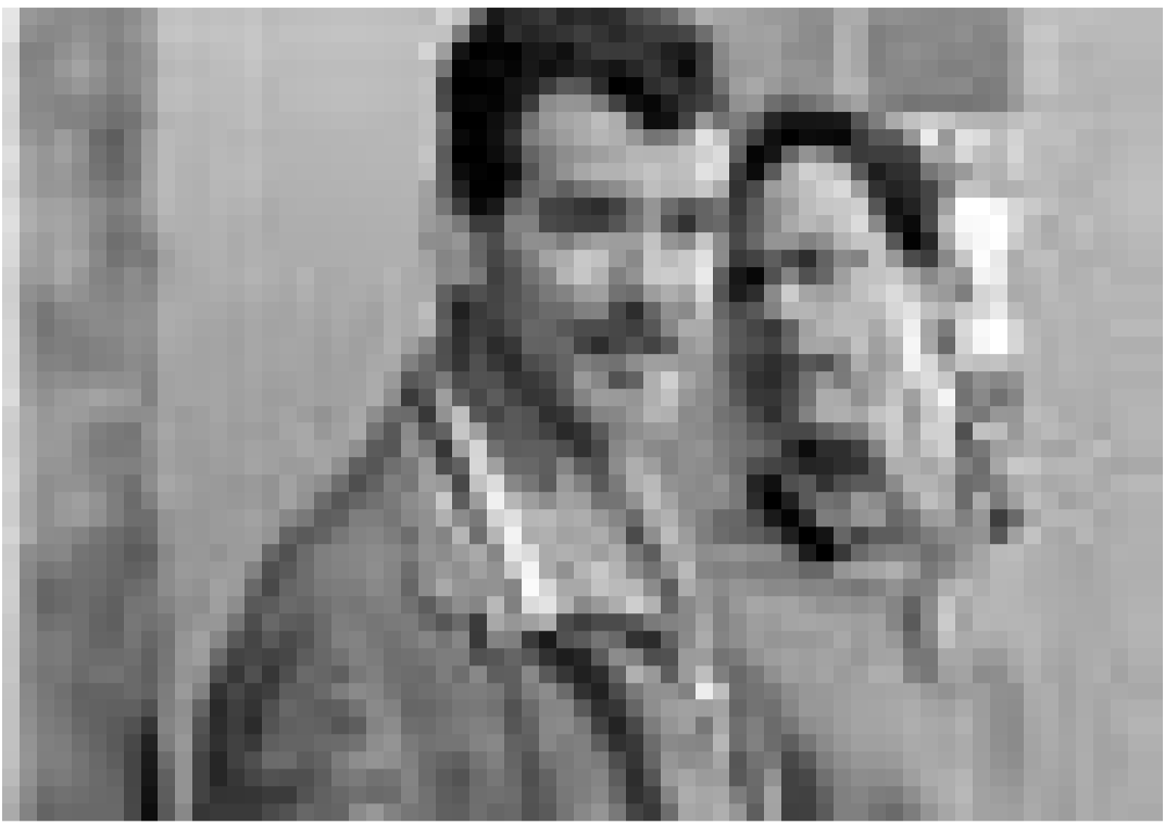
Ein Freund drängt sich auf ... Pierce Brosnan und Greg Kinnear in "The Matador" von Richard Shepard. Neu im Utopolis.