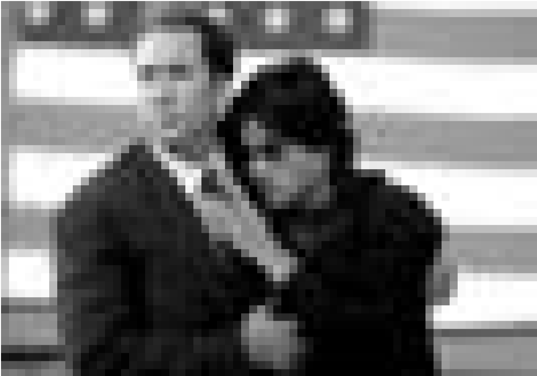
Ein Mann für riskante Geschäfte .... Nicolas Cage und Jared Leto in "Lord of War" von Andrew Niccol. Neu im Utopolis.