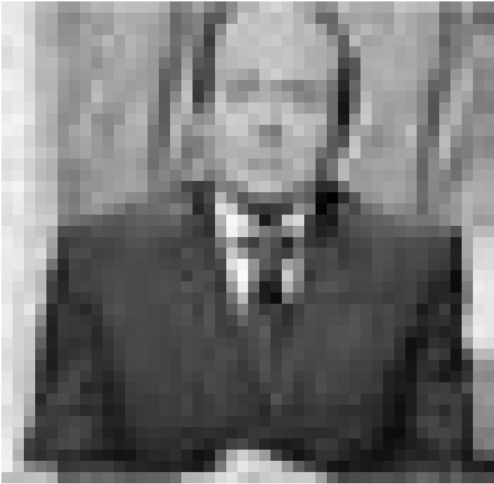
Le documentaire qui fait trembler Berlusconi ... de Sabina Guzzanti. Nouveau à l'Utopia.

Dans une Italie où Berlusconi contrôle la quasi-totalité des médias, Sabina Guzzanti, célèbre humoriste italienne, voit son show déprogrammé de la télévision publique après sa première diffusion sous le prétexte de "vulgarité" et d'insultes au gouvernement. A l'occasion de cette mise à pied, Sabina Guzzanti va enquêter avec autant d'humour que de sérieux auprès de la classe politique et médiatique sur l'état de la démocratie en Italie et en Europe.