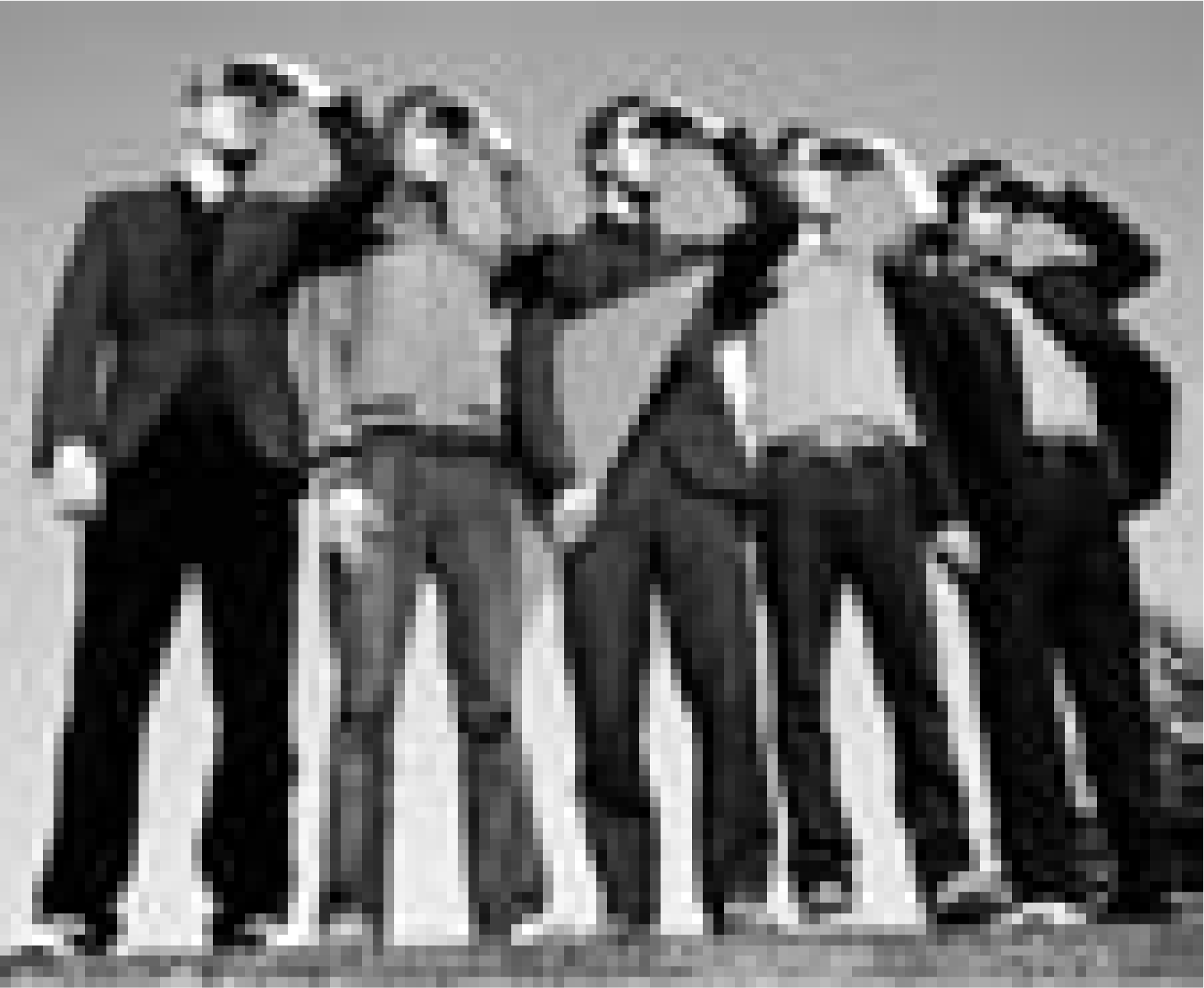
Veröffentlichten 2005 mit "A Certain Trigger" das aufregendste Debutalbum des Jahres: Maximo Park stellen am 28. Juni ihre punkige Musik dem Publikum im Atelier vor.

Ourdaller Maart , Verkauf von regionalen Produkten aus Landwirtschaft und Handwerk, Besichtigung der Brauerei, Musikanimation und vieles mehr,