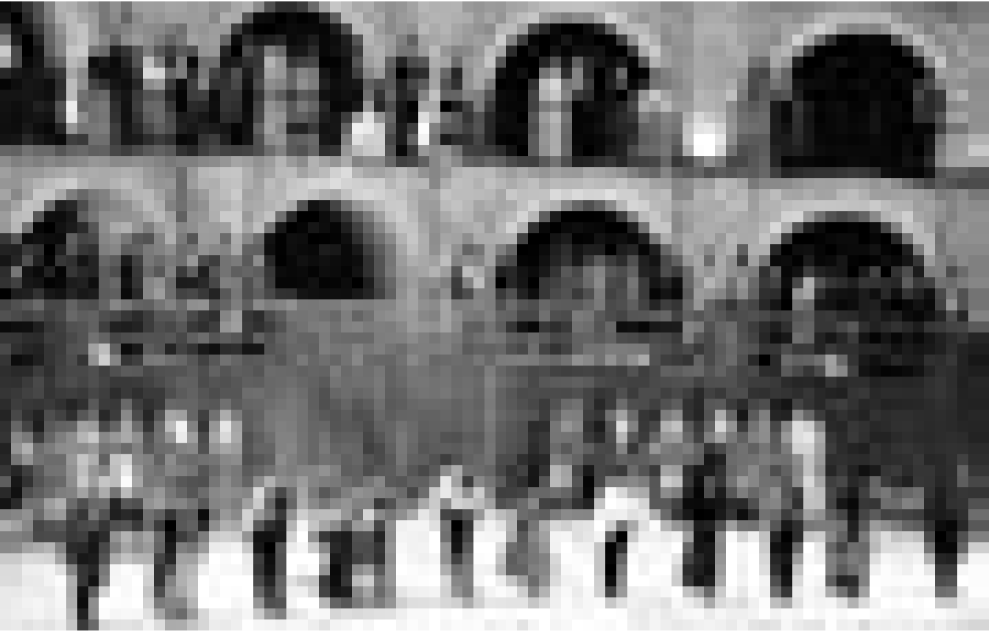
Le festival de Wiltz bat son plein: ce weekend appartient à Carmen de Georges Bizet, une production de l'opéra de Wroclaw.