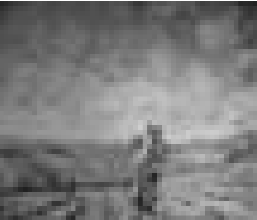
Les Amis des Musées provinciaux luxembourgeois présentent en ce mois d'avril à l'Auberge du Prévost du Fourneau Saint-Michel à Saint-Hubert les toiles du peintre impressionniste André Rosière.