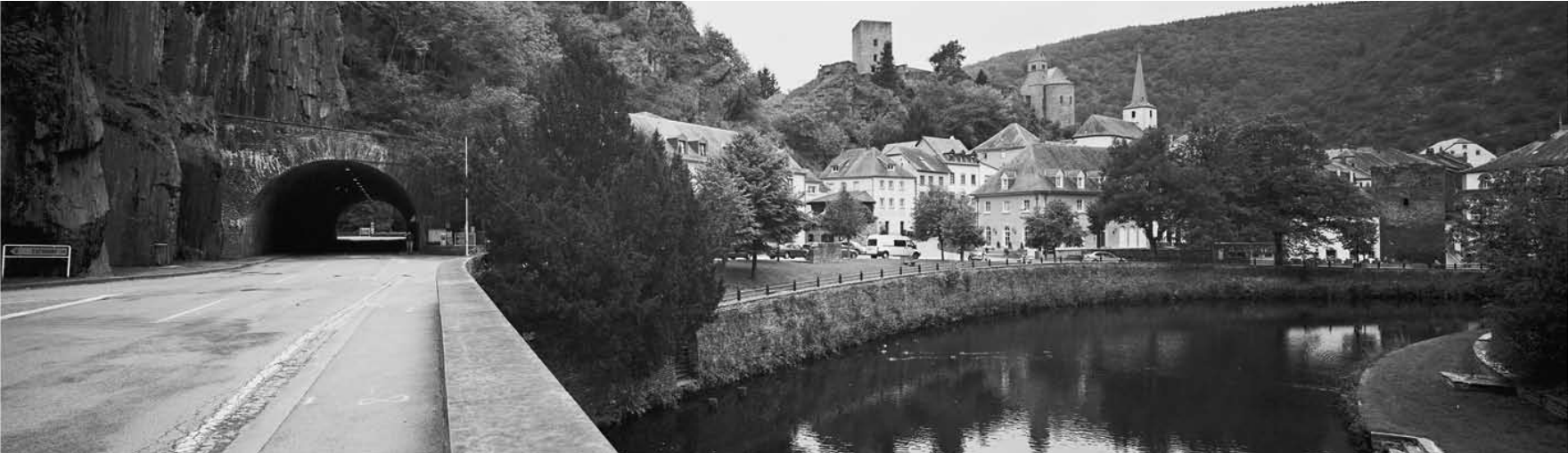
Le ciel ouvert... exposé sous le ciel ouvert. C'est à Clervaux, dans le cadre du programme « Clervaux, Cité de l'image », jusqu'au 18 mai.

Visites guidées les je. 18h (L), sa. 15h (F) et di. 15h (L).