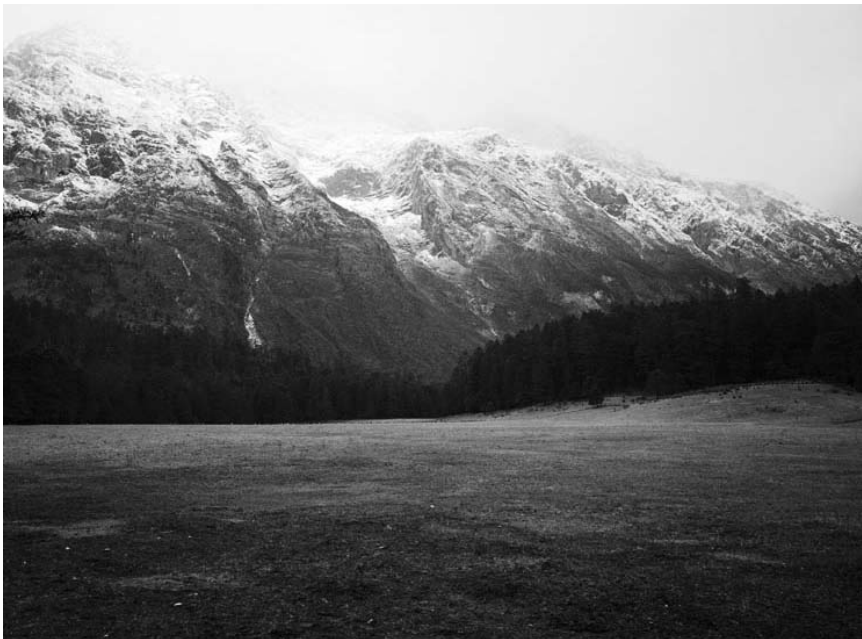
L'amour peut aussi être un paysage. Emily Bates « Love Scenes », au Casino Forum d'art contemporain, jusqu'au 29 juin.

Nathalie Amand : Hôpital militaire photographies, Maison de la Culture (Parc des Expositions, tél. 0032 63 24 58 56), jusqu'au 11.5, ve. - di. 14h - 18h.