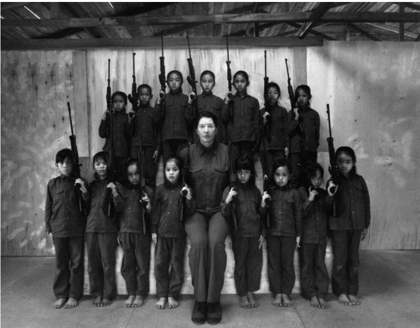
Videoarbeit und Fotografien: Marina Abramovics erste Ausstellung in Luxemburg startet am 24. Mai in der Galerei Beaumont.