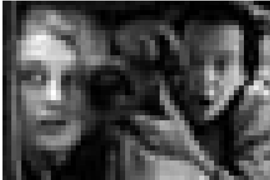
Chasse à la photo exclusive qui les rendra riche. Michael Pitt et Steve Buscemi dans « Delirious ». Nouveau à l'Utopia.

In der 4. Episode um die Abenteuer des berühmten Archeologen Indiana Jones bekommt er diesmal Verstärkung auf seiner Jagd nach mysteriösen Artefakten von einer alten Bekannten und seinem „noch unbekannten“ Sohn.