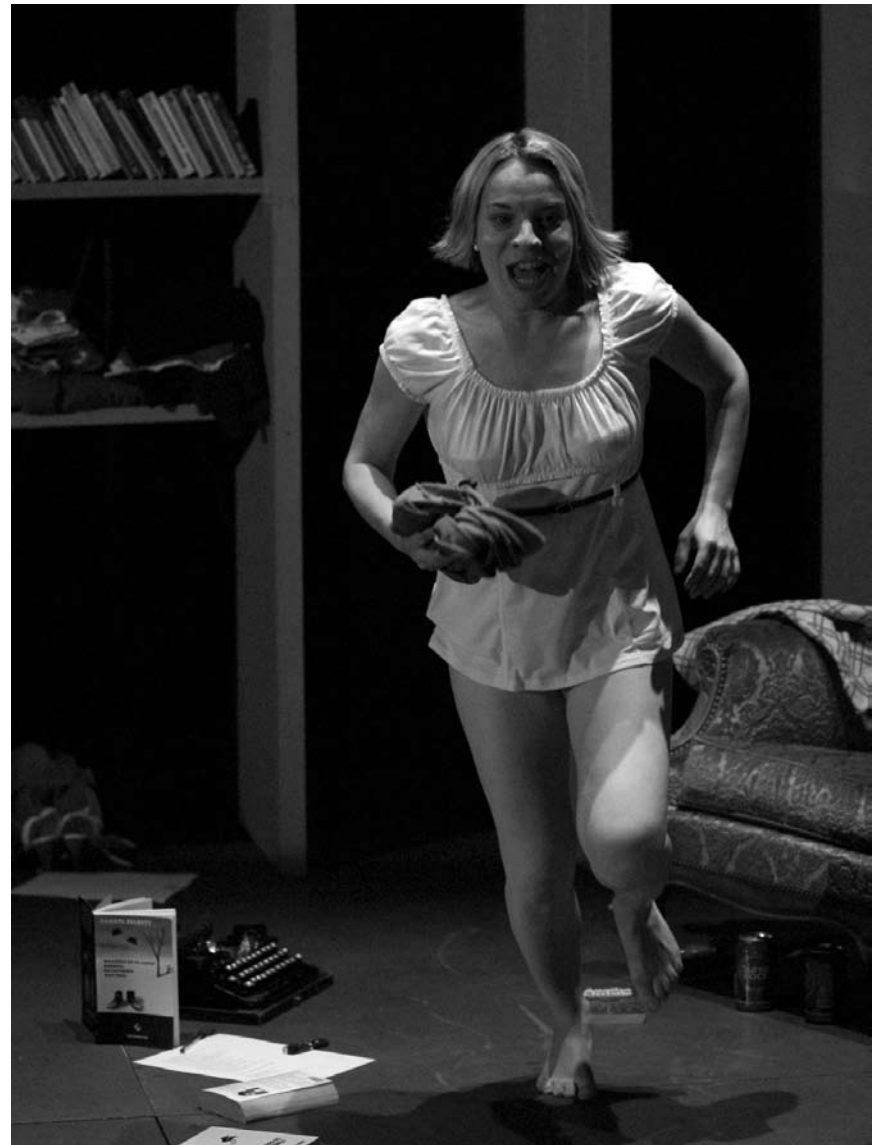
Dernières représentations à Esch : Mammuthus exilis, pièce de Jérôme Netgen, encore ce vendredi 20, et le mardi 24 juin à la Kulturfabrik.