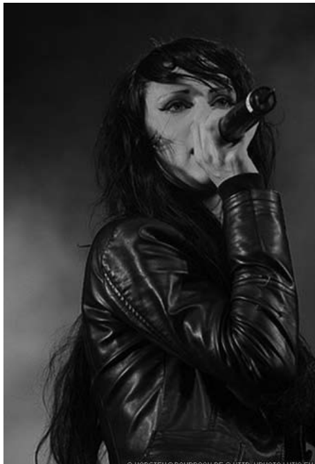
Jennifer Weist, la chanteuse du groupe Jennifer Rostock. En tourné à Treves ce jeudi.