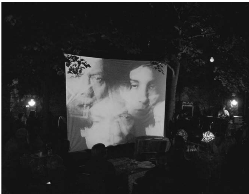
Volles Programm: Am 30. August lädt der Kultur- und Werkhof Nauwieser 19 in Saarbrücken zum Hoffest.

Saarbrücken, 10h. Tel. 0049 681 39 95 38.