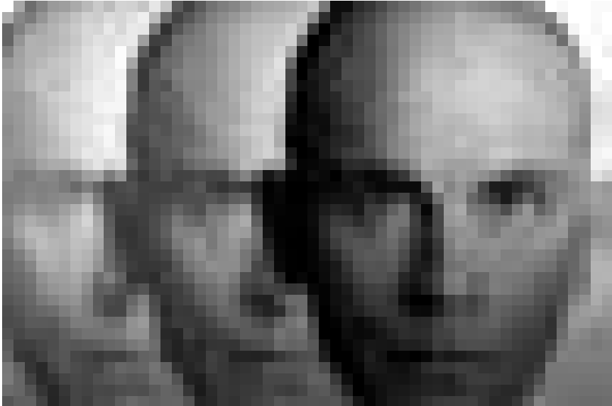
Les profondeurs du cerveau de l'acteur John Malkovich. « Being John Malkovich », mardi à la Cinémathèque.

Rick Riker ist ein Loser, wie er im Buche steht. Er ist ein Schwächling, saumäßig schüchtern und sieht maximal mittelpfächtig aus. Das ändert sich jedoch schlagartig, als er bei einem Laborbesuch von einer genmanipulierten Libelle gestochen wird. Jetzt ist er Dragonfly - ein totaler Superheld mit übernatürlichen Kräften.