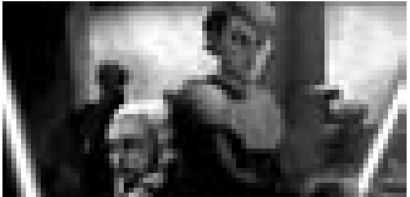
Wiedermal Krieg in den Sternen: „Star Wars: The Clone Wars“. Neu im Utopolis (Luxemburg), Starlight (Düdelingen) und Kinosch (Esch).

Pandabär Po träumt davon mit Kung-Fu-Künsten jeden Gegner zu erledigen, arbeitet aber in Wirklichkeit im Restaurant seiner Eltern und ist behäbig, dick und ungeschickt. Ein Pandabär eben. Kung-Fu-Meister Shifu hingegen hat fünf Top-Kämpfer minutiös ausgebildet. Einer soll ausgewählt werden um die Bevölkerung vor dem Bösen zu schützen.