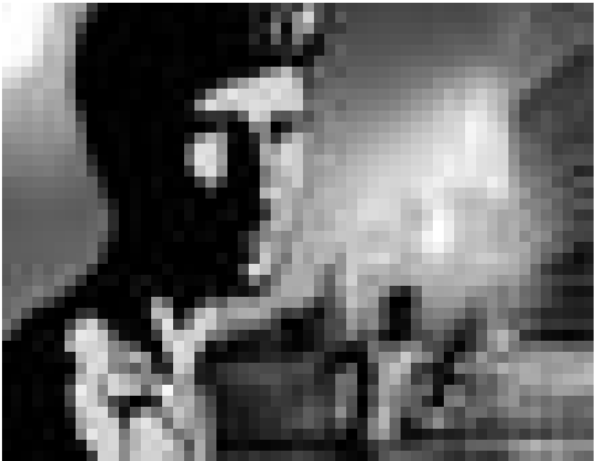
Un film animé et autobiographique du metteur en scène israélien Ari Folman sur ses souvenirs de la guerre au Liban. « Waltz with Basir », nouveau à l'Utopia.