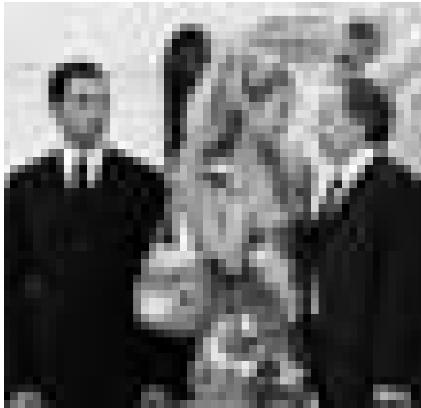
Audrey a des admirateurs de toutes sortes. Roschdy Zem, Louise Bourgoïn et Fabrice Lucchini dans « La fille de Monaco ». Nouveau à l'Utopia.

Bienvenue chez les Ch'tis F 2007 de et avec Dany Boon. Avec Kad Merad et Zoé Félix. 106'. V.o.